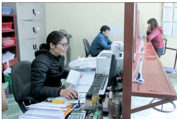
Giao dịch một cửa tại Bảo hiểm xã hội huyện Đông Hưng.

Nhằm thực hiện tốt các chế độ chính sách cho người tham gia bảo hiểm xã hội (BHXH), năm 2017, ngành Bảo hiểm xã hội đã đẩy mạnh công tác tuyên truyền; tổ chức nhiều hội nghị đối thoại trực tiếp với người dân để giải đáp những thắc mắc về thủ tục, việc tham gia và hưởng chế độ BHXH, đồng thời thực hiện nghiêm công tác cải cách thủ tục hành chính, nâng cao chất lượng phục vụ. Nhờ đó, hơn 15.300 người đã được giải quyết hưởng chế độ BHXH, trong đó, trên 12.110 người được giải quyết hưởng trợ cấp một lần, gần 3.210 người hưởng trợ cấp hàng tháng. Bên cạnh đó, ngành cũng đã kiểm tra, đối chiếu và lập danh sách 2.269 người hưởng bảo hiểm thất nghiệp (BHTN).