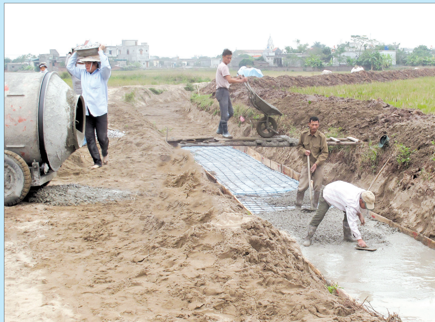
Nông dân huyện Tiên Hải củng cố kênh mương phục vụ sản xuất.