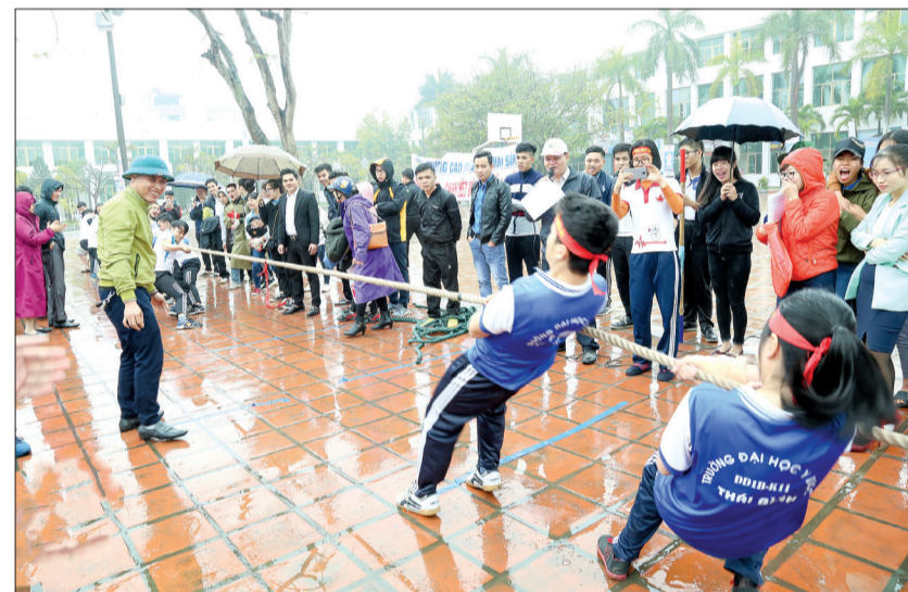
Thi đấu kéo co - một trong những hoạt động của ngày hội.