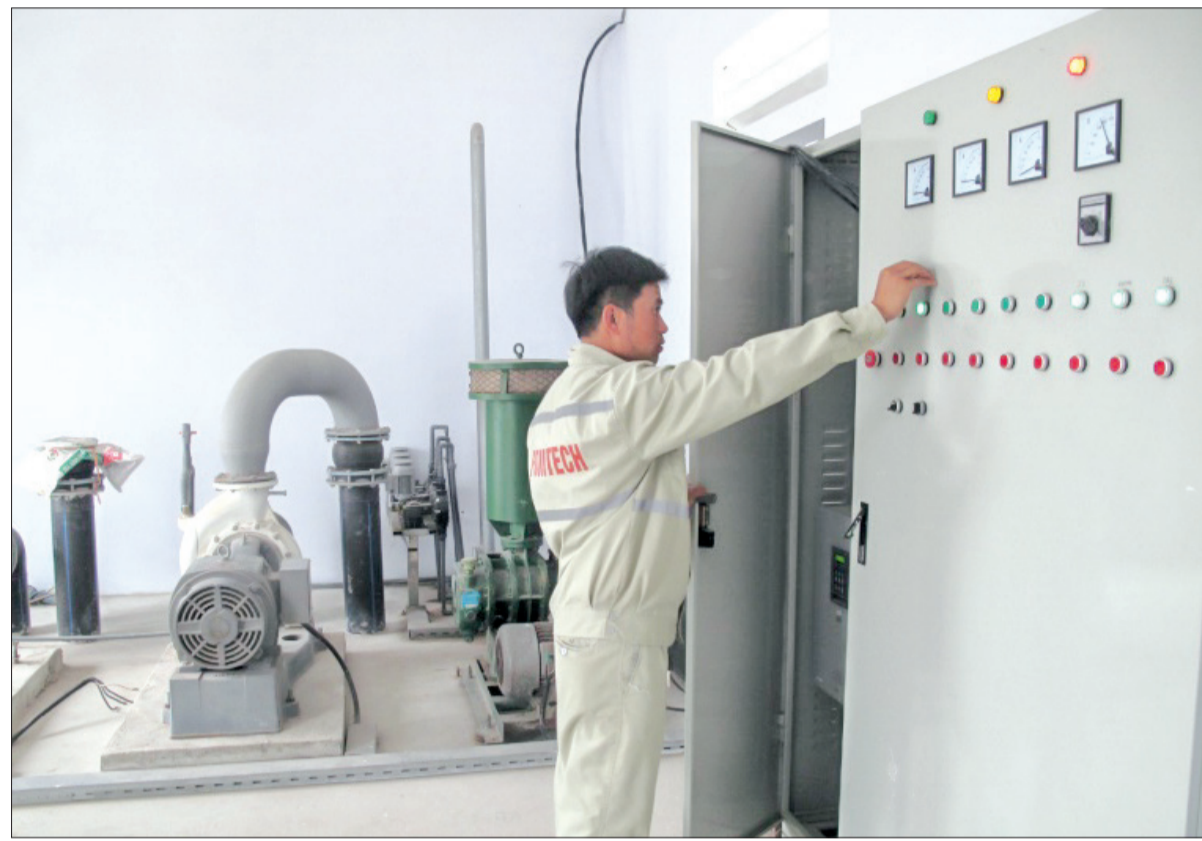
Công nhân nhà máy nước sạch Công ty TNHH Tấn Phát vận hành trạm bơm nước.

Đến hết tháng 12/2016, trên địa bàn tỉnh đã có 263/263 xã có đường ống cấp 1 cấp nước sạch đến trung tâm xã. Hiện nay, các cấp, các ngành trong tỉnh cũng như các doanh nghiệp đang tập trung hoàn thành mục tiêu hết năm 2017 có trên 60% tỷ lệ hộ dân nông thôn trên địa bàn tỉnh sử dụng nước sạch và đến năm 2020 tỷ lệ đó đạt 100%.