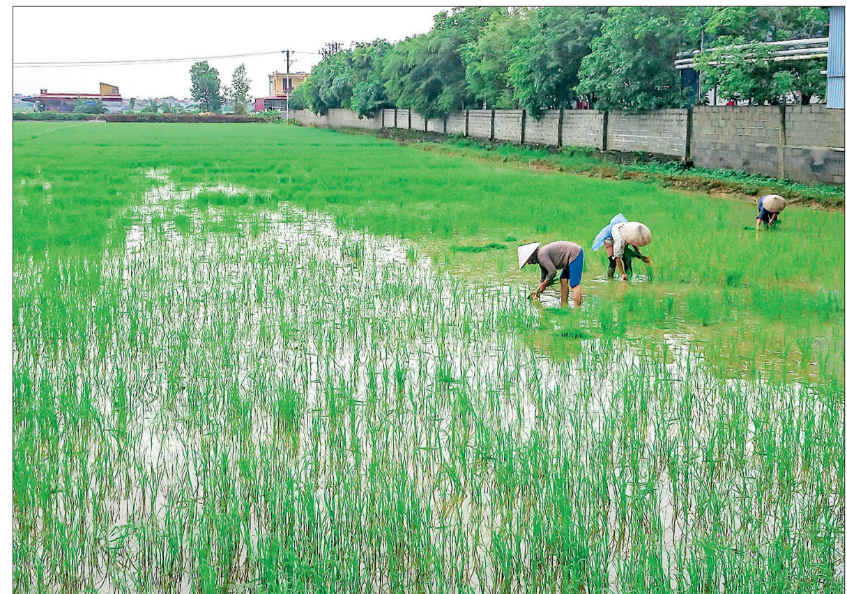
Chỉ sau một đêm ruộng lúa này đã bị chuột cắn quang hẳn, bà con đang dặm lại.