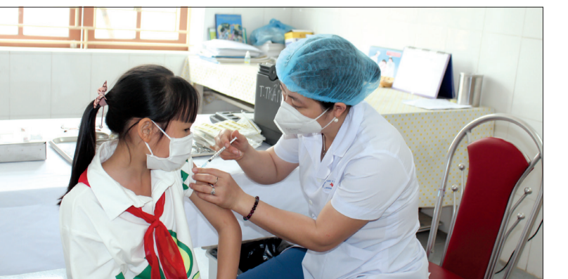
Học sinh lớp 6 Trường THCS Phạm Huy Quang được tiêm vắc-xin phòng Covid-19.

Trước khi cho con đi tiêm, tôi cũng khá lo lắng và hồi hộp. Tuy nhiên, sau khi được tuyên truyền về lợi ích của việc tiêm vắc-xin phòng Covid-19 cho trẻ cũng như thấy được sự chuẩn bị chu đáo, sự đồng tiếp, sắp xếp khoa học của ngành y tế, địa phương, nhà trường tại điểm tiêm nên tôi rất yên tâm. Tôi rất phấn khởi vì con đã được tiêm vắc-xin, có kháng thể để phòng bệnh.