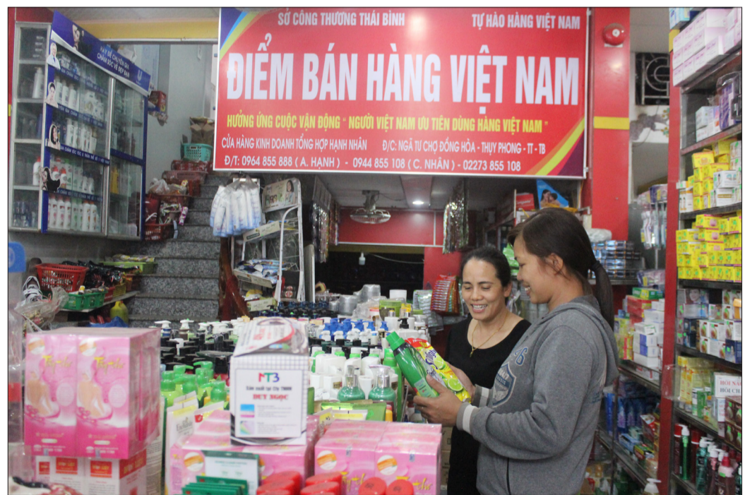
Điểm bán hàng Việt tại cửa hàng kinh doanh tổng hợp Hạnh Nhân, xã Thụy Phong - địa chỉ mua sắm tin cậy.

Sau một thời gian thành lập và đi vào hoạt động, điểm bán hàng Việt tại xã Thụy Phong (Thái Thụy) đã trở thành địa chỉ mua sắm tin cậy của người dân địa phương, đồng thời là kênh phân phối hàng Việt Nam chất lượng đến người tiêu dùng.