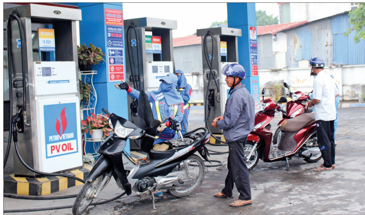
Công ty Cổ phần Xăng dầu luôn thực hiện tốt nghĩa vụ về thuế.

Giai đoạn 2015 - 2019, ngành Thuế đạt được tổng thu nội địa gần 35.600 tỷ đồng, đạt 135% so với dự toán, tăng gấp gần 2,7 lần so với giai đoạn 2010 - 2015, về đích trước 4 năm so với mục tiêu Nghị quyết Đại hội Đảng bộ tỉnh lần thứ XIX đề ra với số thu thuế vượt hơn 9.100 tỷ đồng. Để có được kết quả đó, một trong những nguyên nhân quan trọng đó là ngành Thuế luôn chú trọng phát động sâu rộng các phong trào thi đua, tạo động lực tăng thu cho ngân sách nhà nước.