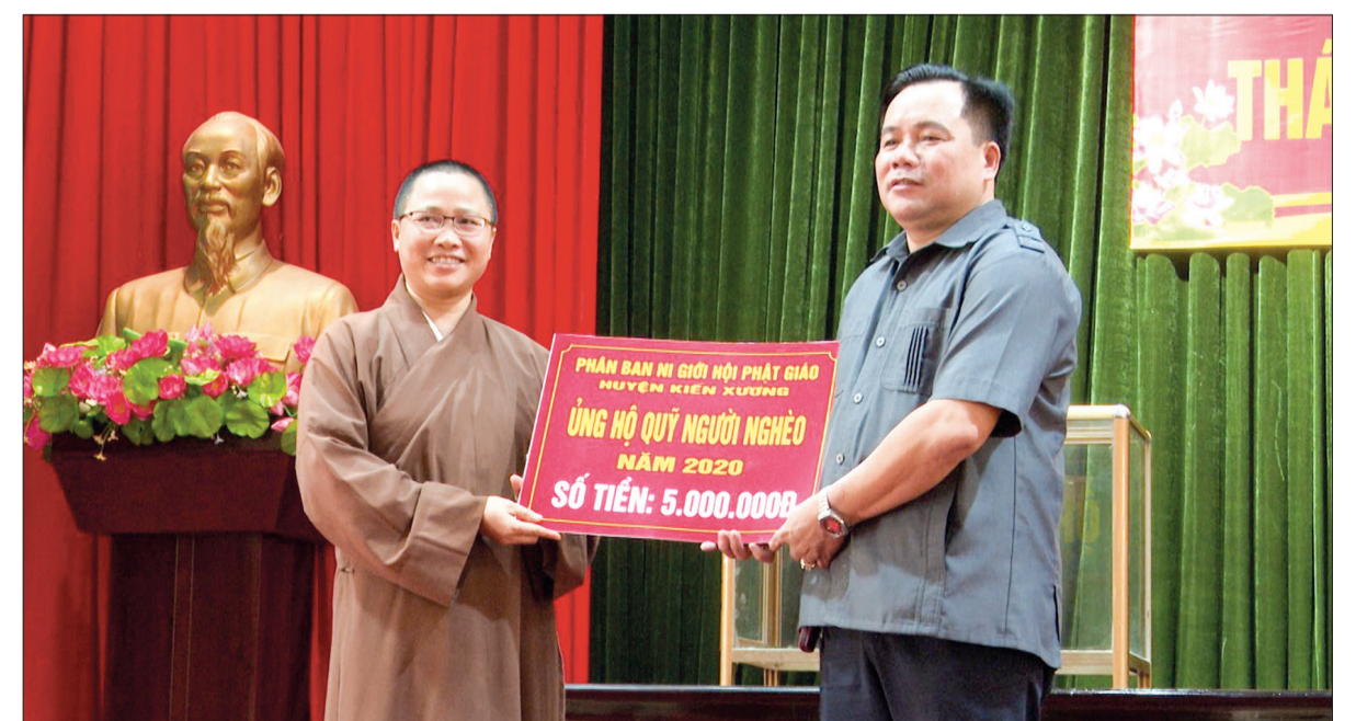
Ủy ban MTTQ huyện Kiến Xương tiếp nhận ủng hộ quỹ "Vi người nghèo" năm 2020.