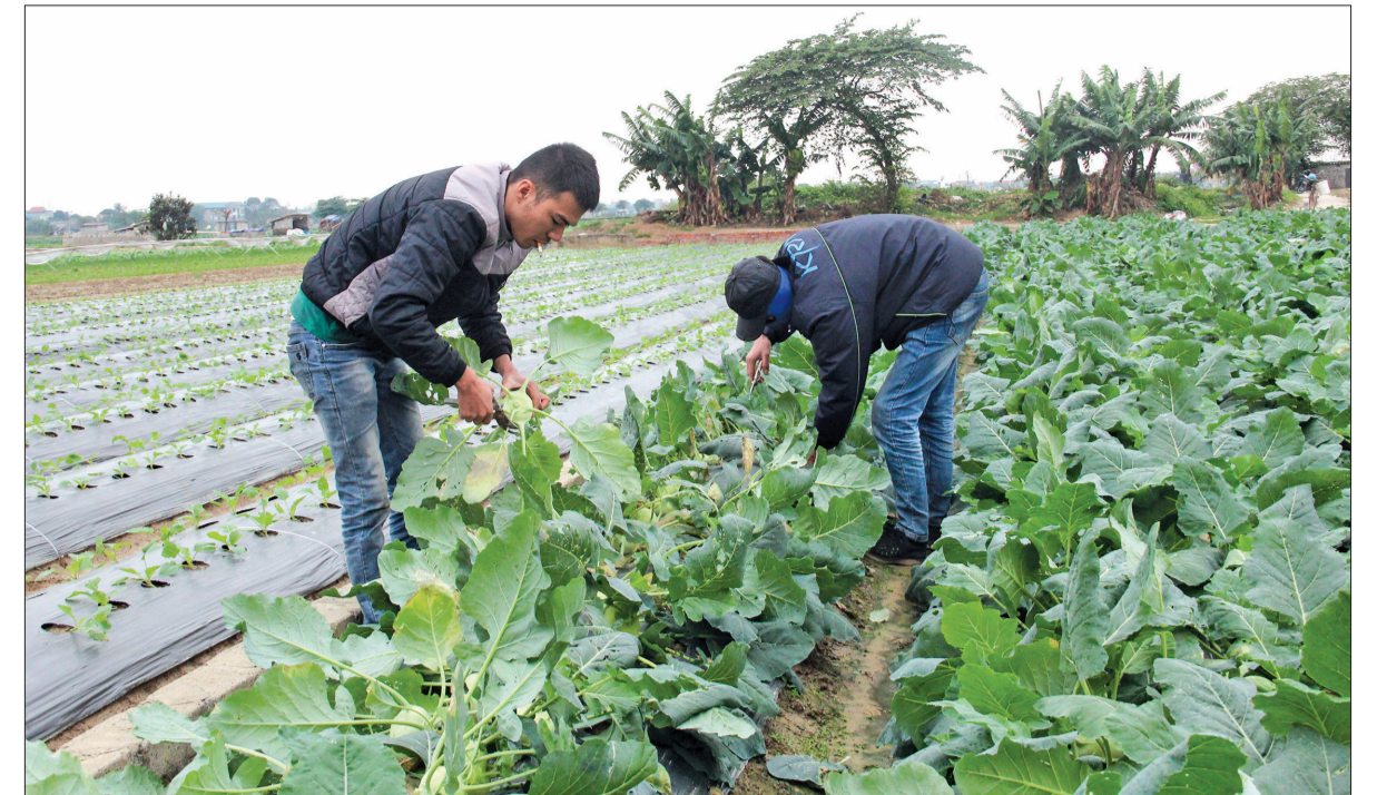
Vùng sản xuất rau an toàn của xã Quỳnh Hải (Quỳnh Phụ).

mua; 6,72 triệu đồng/ha khoai tây với giống khoai tây mua thông qua các HTX NN; hỗ trợ 13.000 đồng/kg củ giống, số lượng 40kg củ giống/sào đối với giống khoai tây Marabel nhập khẩu. Huyện hỗ trợ 2 vùng sản xuất rau bắp cải tập trung theo hướng sản xuất rau an toàn của xã Hồng Phong và xã Vũ Văn, quy mô 20ha/vùng, cơ chế hỗ trợ 7 triệu đồng/ha. Ngoài ra, hỗ trợ ứng dụng tiến bộ khoa học kỹ thuật với mức từ 200.000 - 800.000 đồng/sào cho vùng sản xuất khoai tây Jelly diện tích 3ha tại xã Tân Phong, ngô nếp TBM18 diện tích 1,5ha tại xã Song Lãng. Cùng với cơ chế hỗ trợ, Vũ Thư xây dựng cơ chế khen thưởng từ 5 - 15 triệu đồng/xã, trị trấn cho những đơn vị có diện tích vụ đông dưới 100 - 200ha trở lên; 10 triệu đồng/cụm khi tất cả các xã, thị trấn trong cụm đạt và vượt kế hoạch diện tích vụ đông huyện giao.