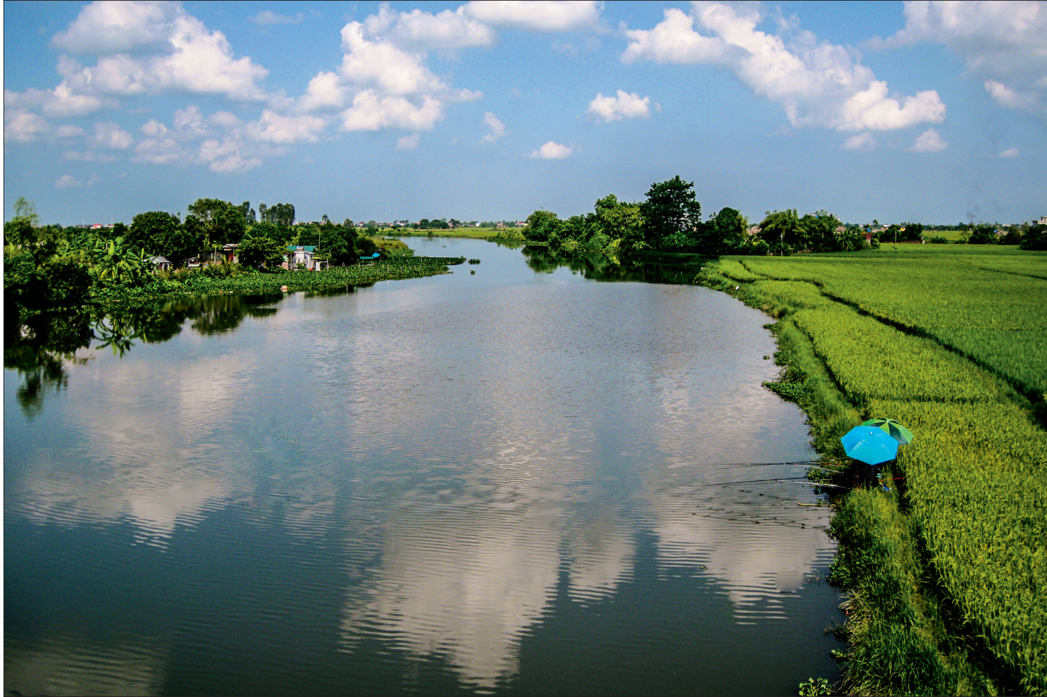
Cùng với sông Hồng, sông Luộc, sông Trà Lý..., dòng Diêm Hộ cũng là nguồn nước ngọt dồi dào không chỉ cung cấp nước cho canh tác nông nghiệp mà còn là phòng tuyến quân sự của các triều đại phong kiến.