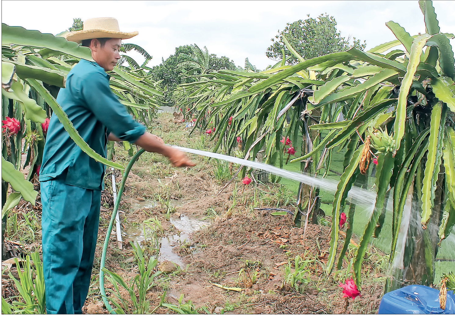
Nông dân xã Minh Khai (Vũ Thư) ứng dụng khoa học kỹ thuật, nâng cao hiệu quả trồng cây ăn trái trên đất chuyển đổi.

23 năm qua kể từ ngày thành lập trung tâm học tập cộng đồng (TTHTCĐ) đầu tiên tại xã Việt Thuận (Vũ Thư), các TTHTCĐ trên địa bàn tỉnh đã khẳng định được vai trò, vị trí trong việc góp phần nâng cao dân trí và có tác động tích cực đối với sự phát triển kinh tế - xã hội của địa phương.