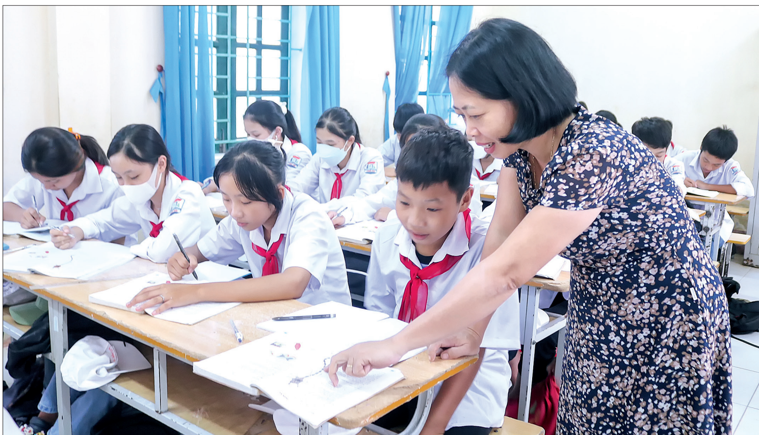
Tiết học của cô và trò Trường Tiểu học và THCS Thụy An (xã An Tân, huyện Thái Thụy).