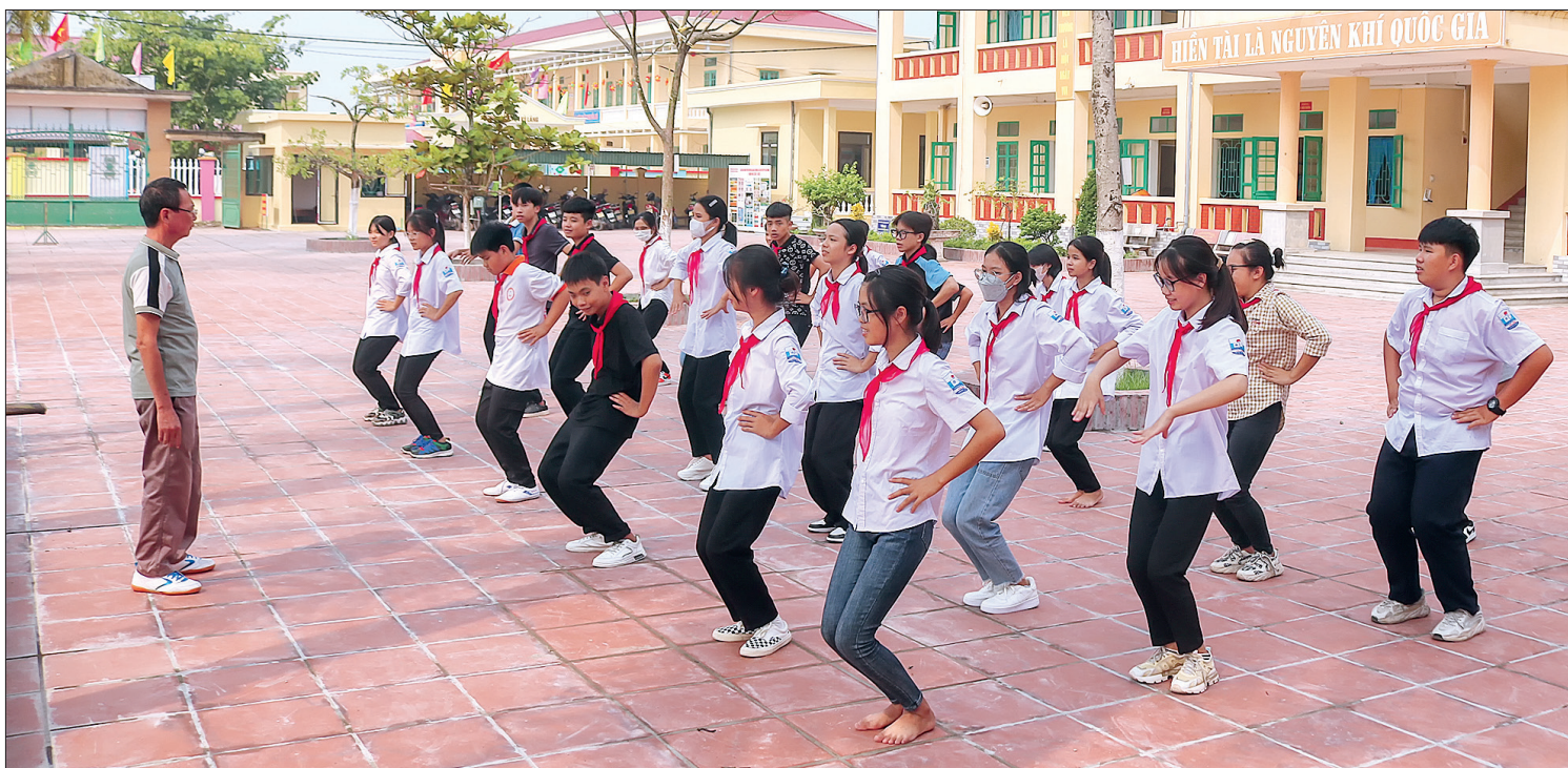
Tiết thể dục của học sinh Trường Tiểu học và THCS Vũ Lăng (Tiền Hải).