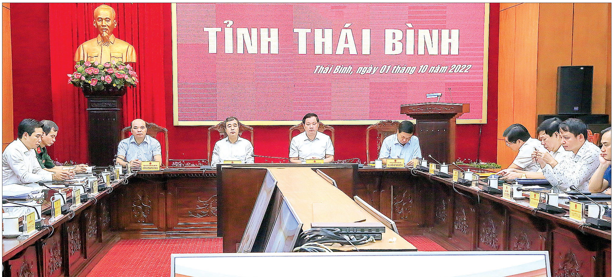
Các đồng chí lãnh đạo tỉnh dự phiên họp tại điểm cầu Thái Bình.