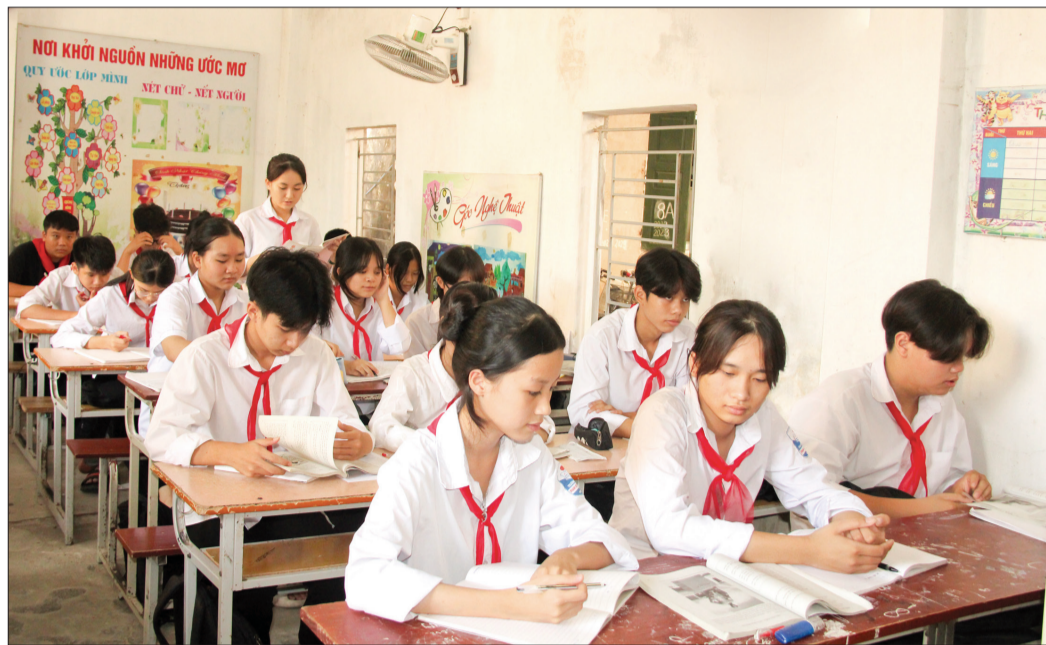
Học sinh Trường THCS Phạm Huy Quang bước vào năm học mới với nhiều quyết tâm mới.

Năm học 2021 - 2022, ngành giáo dục huyện Đông Hưng bứt phá vươn lên vị trí dẫn đầu khối các huyện, thành phố trong tỉnh. Đây là kết quả từ sự đoàn kết, thống nhất, không ngừng đổi mới, sáng tạo, nâng cao chất lượng giáo dục toàn diện, giáo dục mũi nhọn. Bước vào năm học 2022 - 2023, toàn ngành triển khai nhiều giải pháp phấn đấu duy trì, giữ vững thành tích đã đạt được.