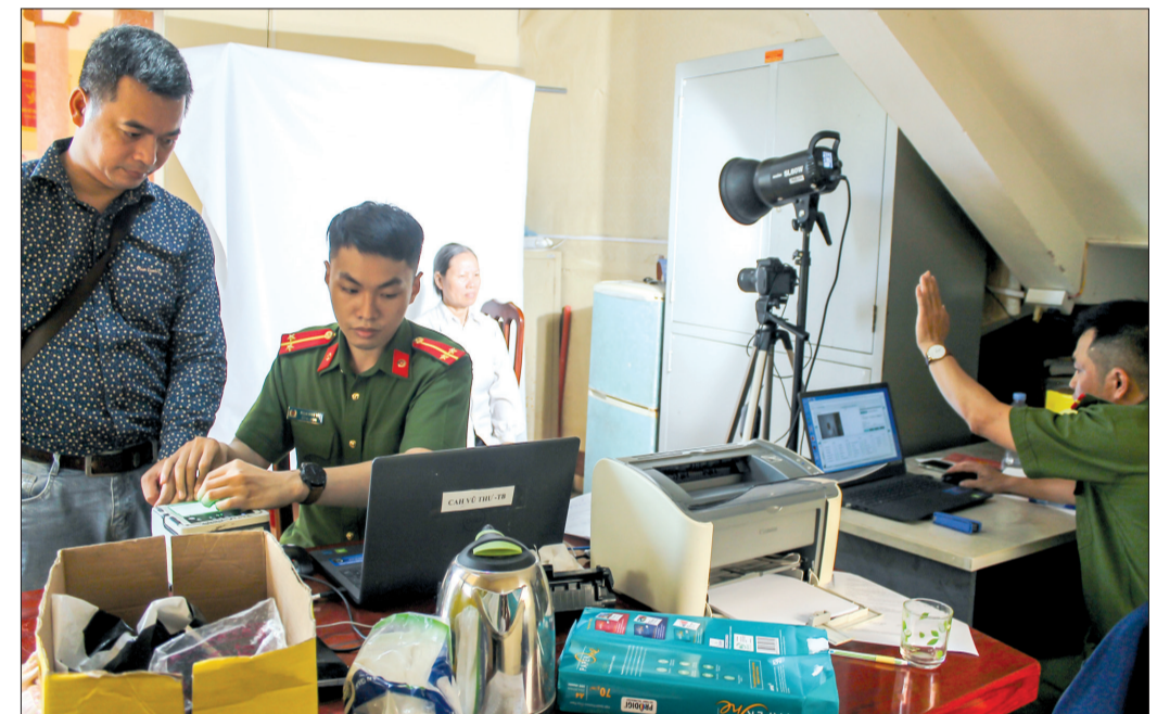
Công an huyện Vũ Thư tổ chức cấp cần cước công dân lưu động tại xã Song An.

Nhằm hỗ trợ các KSNH, cơ sở lưu trú, cơ sở kinh doanh trong việc thực hiện đúng quy định của Luật Phòng, chống tác hại của thuốc lá, năm 2022, Ban Chỉ đạo PCTHCTL tỉnh đã tổ chức đoàn giám sát liên ngành thực thi Luật Phòng, chống tác hại của thuốc lá tại các KSNH, cơ sở lưu trú trên địa bàn tỉnh. Trong tháng 9/2022, đoàn đã tiến hành giám sát đợt 1 tại 20 KSNH, cơ sở lưu trú, cửa hàng kinh doanh thuốc lá trên địa bàn huyện Đông Hưng và thành phố Thái Bình.