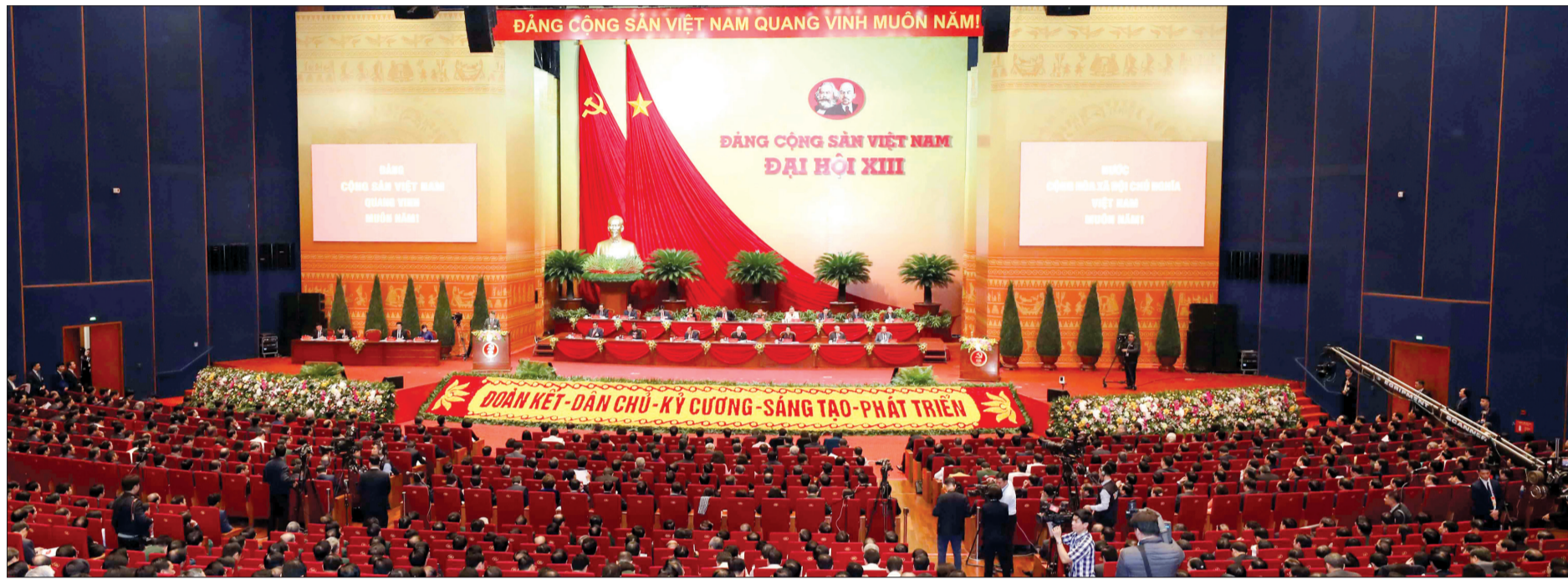
Đại hội đại biểu toàn quốc lần thứ XIII của Đảng họp phiên trừ bị.

■ Đại hội đại biểu toàn quốc lần thứ XIII của Đảng hoàn thành ngày làm việc đầu tiên