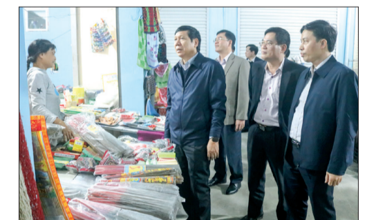
Các đồng chí lãnh đạo tỉnh kiểm tra công tác phòng, chống cháy, nổ tại chợ Quỳnh Côi.