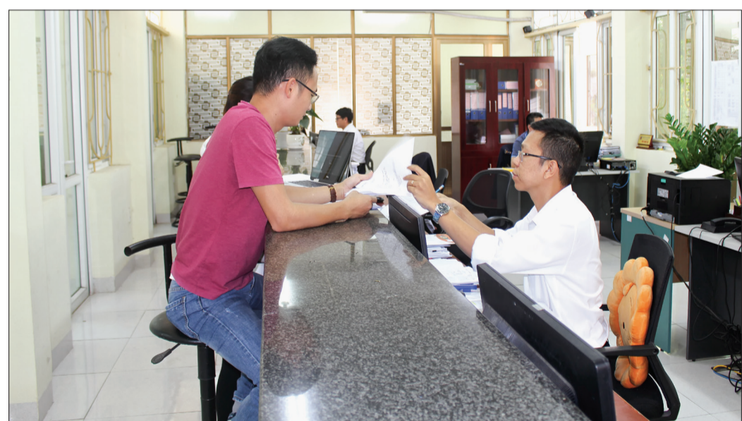
Cán bộ Chi cục Hải quan Thái Bình hướng dẫn doanh nghiệp làm thủ tục khai báo hải quan.

với năm 2018, trong đó có 170 doanh nghiệp hoạt động theo loại hình gia công, sản xuất hàng xuất khẩu, chế xuất; tổng số tờ khai Chi cục đã làm thủ tục xuất nhập khẩu đạt 84.000 tờ với 39.000 tờ khai nhập khẩu và 45.000 tờ khai xuất khẩu; 100% tờ khai đều đã thực hiện thông quan điện tử, trong đó có 90% tờ khai luồng xanh. Bên cạnh đó, Chi cục Hải quan Thái Bình còn phối hợp chặt chẽ với Ban Chỉ đạo ISO của Cục Hải quan Hải Phòng hướng dẫn, kiểm tra các bộ phận thực hiện, trên cơ sở đó kịp thời điều chỉnh cho phù hợp với thực tế. Không chỉ chú trọng cải cách hành chính, năm 2019, Chi cục Hải quan Thái Bình còn duy trì thực hiện có hiệu quả mối quan hệ đối tác tác hải quan - doanh nghiệp, tổ chức ký thỏa thuận phát triển quan hệ đối tác với 269 doanh nghiệp trên địa bàn; tập trung cải tiến phương pháp quản lý, ứng dụng công nghệ thông tin để kiểm soát công việc trong tất cả các lĩnh vực đồng thời cải tiến phương pháp làm việc, không để tồn đọng, sót việc mà không có lý do chính đáng. Bên cạnh đó, Chi cục Hải quan Thái Bình còn quyết liệt thực hiện đồng bộ các giải