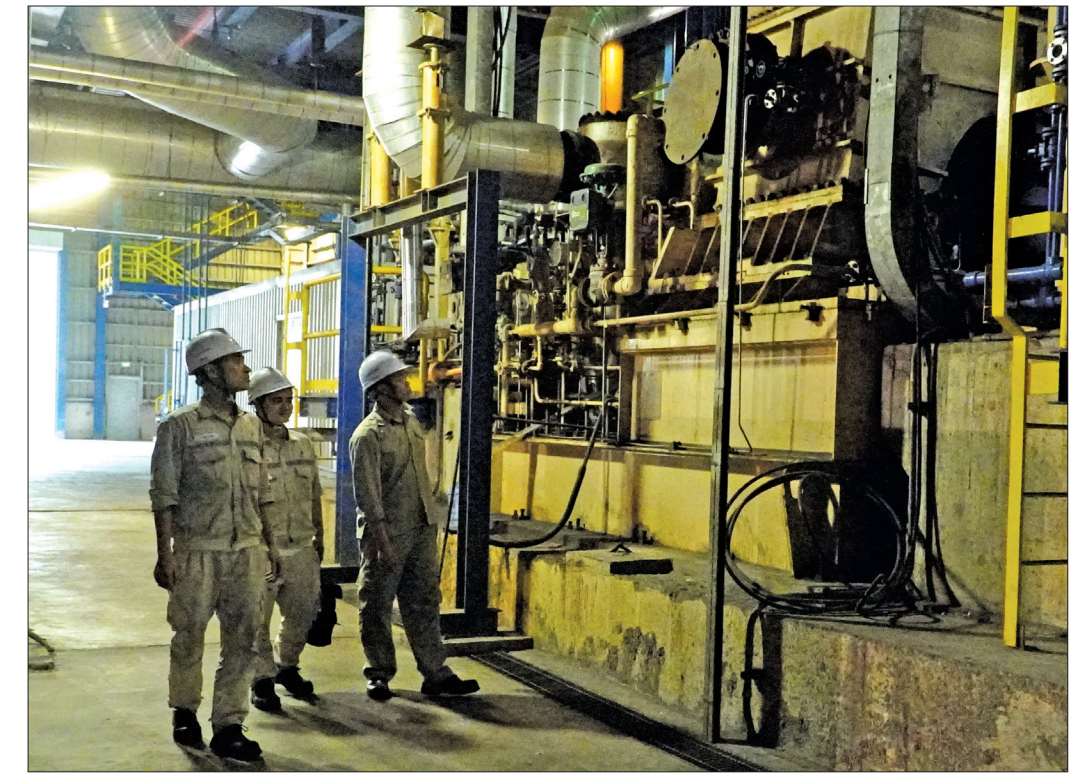
Với 3 ca, 4 kíp, cán bộ, công nhân phân xưởng bảo dưỡng sửa chữa thường xuyên giám sát hoạt động của 2 tổ máy bảo đảm an toàn.

Mùa nắng nóng đang đến gần cũng là lúc người dân, doanh nghiệp lo lắng thiếu điện, cắt điện luân phiên. Nhằm góp phần bảo đảm ổn định nguồn điện phục vụ sản xuất, kinh doanh và sinh hoạt, Nhà máy nhiệt điện Thái Bình 2 đang nỗ lực chuẩn bị các điều kiện để huy động công suất tối đa, vận hành phát điện an toàn, ổn định.