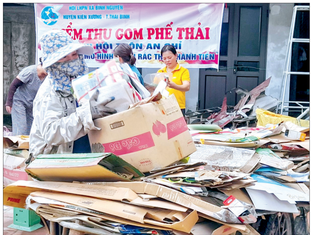
Phụ nữ thôn An Chí, xã Bình Nguyễn (Kiến Xương) thu gom phế liệu gây quỹ.

Phong trào thi đua “Dân vận khéo” thực hiện mô hình thu gom, phân loại, biến rác thải thành tiền gây quỹ hỗ trợ phụ nữ, trẻ em nghèo lan tỏa rộng khắp trong các cấp hội phụ nữ huyện Kiến Xương không chỉ góp phần bảo vệ môi trường mà còn mang ý nghĩa nhân văn sâu sắc, không để ai bị bỏ lại phía sau.