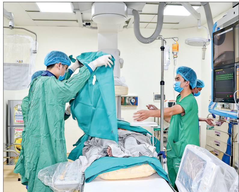
Bệnh viện Đa khoa tỉnh đầu tư nhiều thiết bị hiện đại phục vụ khám chữa bệnh.

với dùng hóa chất gắn trên bề mặt hạt DC Bead, diệt tế bào ung thư tại chỗ. Ưu điểm của phương pháp này là không gây mê, không phải phẫu thuật xâm lấn, không chảy máu. Hóa chất và vật liệu nút mạch được đưa vào qua đường bẹn nên không có biến chứng mạch, bệnh nhân trong quá trình thực hiện kỹ thuật vẫn tỉnh táo nói chuyện được bình thường với bác sĩ. Khi nút mạch cắt nguồn nuôi thành