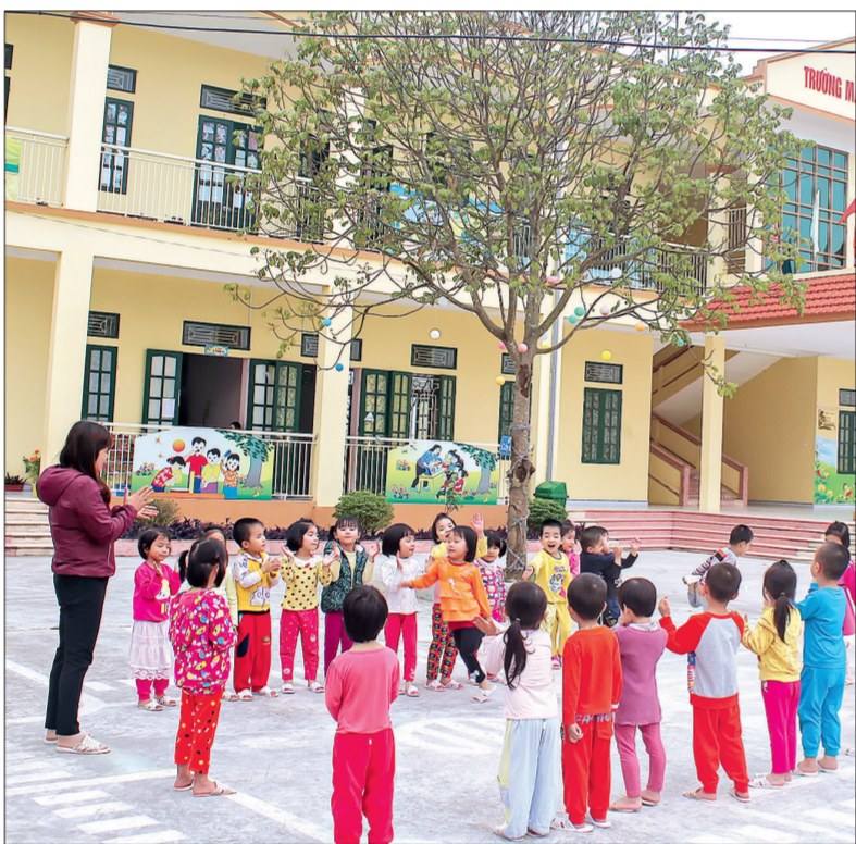
Cô trò Trường Mầm non Đông Dương (Đông Hưng).

Cùng với đầu tư cơ sở vật chất cho các trường học, Đảng ủy thực hiện tốt việc xây dựng mô hình trường liên xã nhằm tiết kiệm chi phí đầu tư, nâng cao chất lượng giáo dục. Đến nay, toàn huyện đã xây dựng thành công 9 trường THCS liên xã, giảm 10 trường THCS so với trước năm 2002, tăng số trường đạt chuẩn quốc gia lên 99 trường (chiếm 82,5%). Thầy giáo Phí Trọng