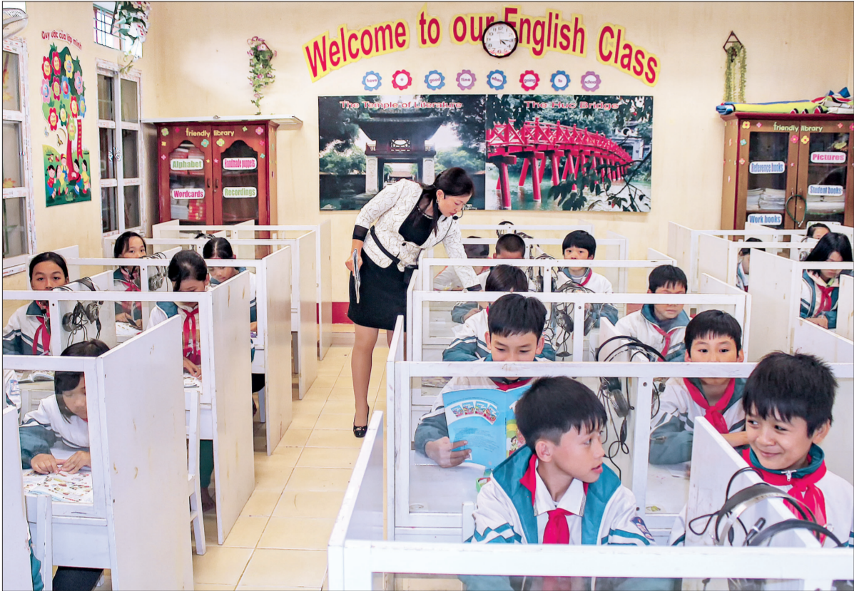
Phòng học ngoại ngữ của Trường Tiểu học Đông Xuân (Đông Hưng).

Dù còn nhiều khó khăn về kinh tế nhưng cấp ủy, chính quyền và nhân dân Đông Hưng luôn dành cho sự nghiệp giáo dục sự quan tâm, đầu tư lớn. Ngành Giáo dục thực hiện nhiều giải pháp để tạo môi trường thuận lợi nhất cho các thầy cô giáo, các em học sinh phát huy hết khả năng, sáng tạo không ngừng trong dạy và học. Vì thế, giáo dục Đông Hưng gặt hái chuỗi thành công 12 năm liên tục dẫn đầu toàn tỉnh.