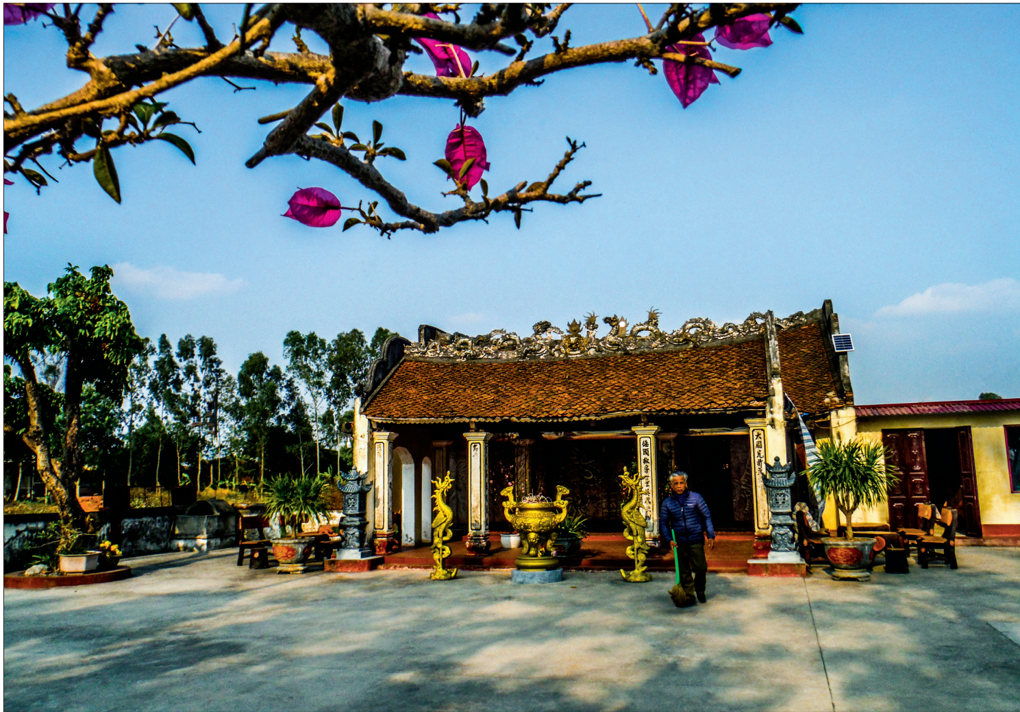
Thuần Mỹ điện, làng Mỹ Xá, tổng Thanh Triều, huyện Ngự Thiên, nay là khu Mễ, thị trấn Hưng Nhân, huyện Hưng Hà, nơi sinh 4 vua nhà Lê thế kỷ XVI vẫn được nhân dân gìn giữ, bảo tồn.

Các nguồn khảo luận cho biết, sau khi vua Lê Thánh Tông băng hà năm 1497, con trai là Lê Hiến Tông (1461 - 1504) kế vị ngai vàng từ năm 1497 đến năm 1504 thì yếu mạng, triều chính nhà Lê sơ điều đứng, loạn triều chính nổ ra khi Túc Tông hoàng đế lên làm vua nhưng cũng chưa tròn nửa năm đã băng hà, thọ 17 tuổi. Thái Hoàng Thái hậu đòi lập Lữ Khôi vương, hoạn quan Nguyễn Nhữ Vi đóng cửa thành phò tá Lê Huyền (tức Lê Uy Mục) lên ngôi. Vừa ngự trên ngai vàng (ngày 22 tháng 3 âm lịch năm 1505), Lê Uy Mục giết ngay Thái Hoàng Thái hậu Nguyễn Thị.