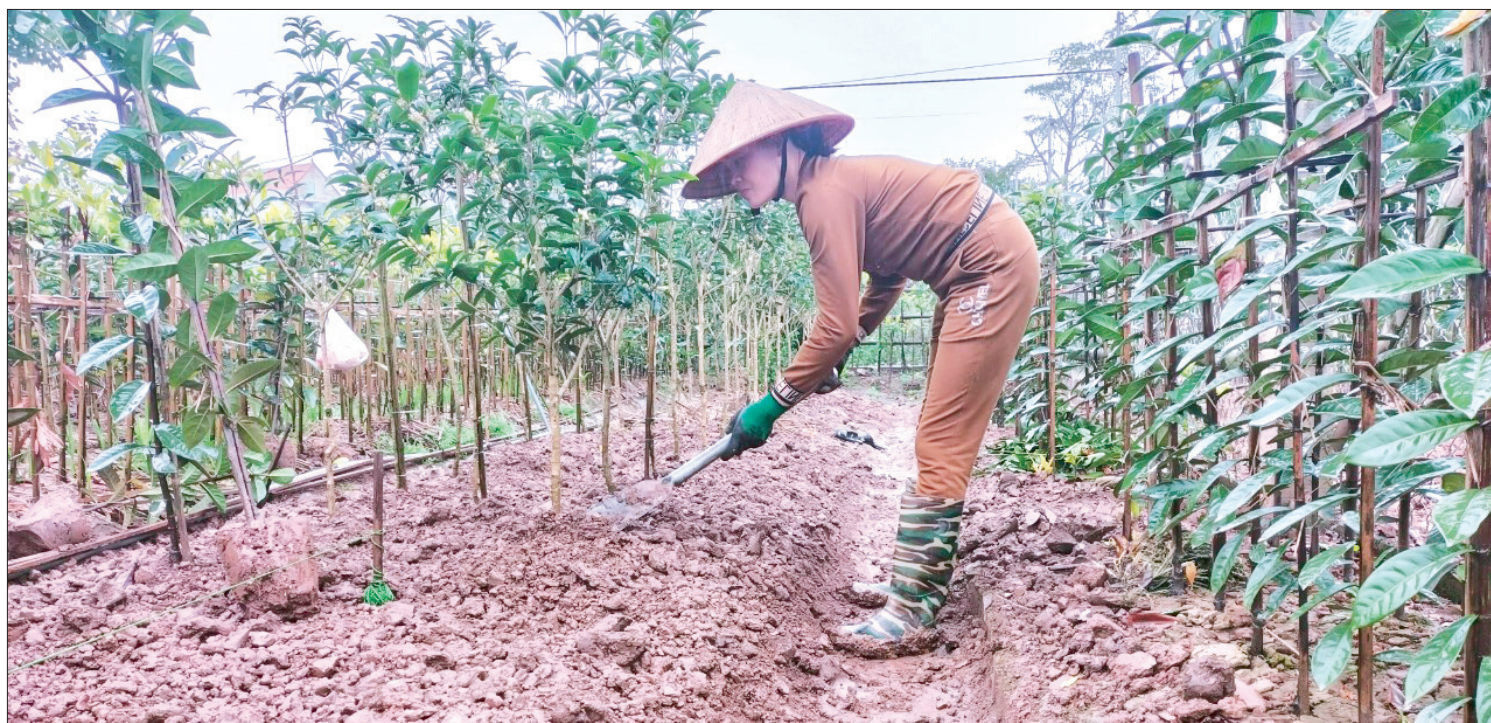
Cây mẫu đơn được chủ vườn trồng mới.

Tiếp nối một vụ tết thắng lợi, ngay từ những ngày đầu xuân, người trồng đào, hoa, cây giống ở Minh Tân (Đông Hưng) lại tất bật bước vào vụ mới.