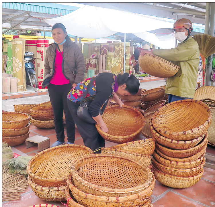
Chợ bày bán đa dạng mặt hàng.

Chợ Sóc, xã Vũ Quý là chợ quê truyền thống nổi tiếng sầm uất nhất ở huyện Kiến Xương từ trước đến nay. Không chỉ là nơi mua bán, trao đổi hàng hóa, chợ Sóc còn là nơi sinh hoạt văn hóa cộng đồng, giao lưu văn hóa vùng miền, thu hút người dân khắp nơi đến tìm hiểu về những nét chợ quê độc đáo.