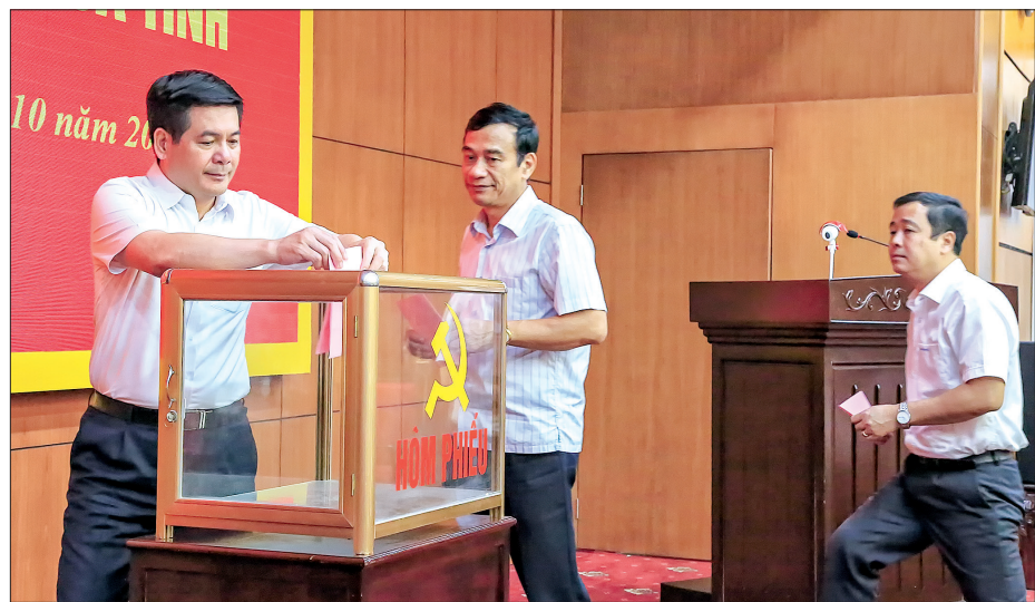
Đại biểu bỏ phiếu giới thiệu nhân sự kiện toàn bổ sung chức danh Phó Bí thư Tỉnh ủy nhiệm kỳ 2015 - 2020.