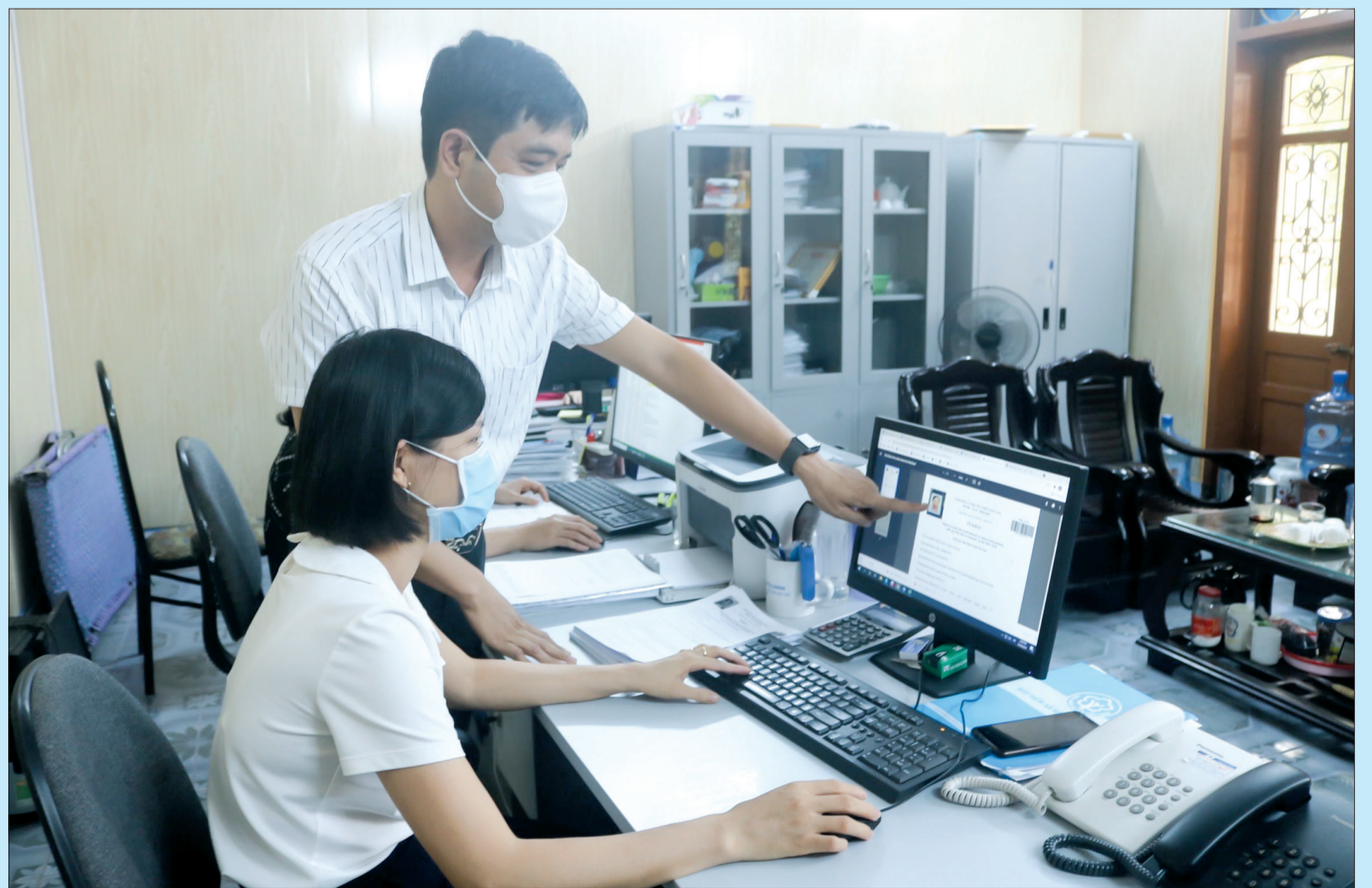
Cán bộ BHXH tỉnh phê duyệt hồ sơ VssID cho người dân.