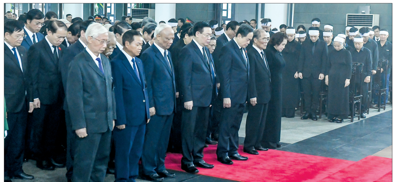
Đoàn Quốc hội nước Cộng hòa xã hội chủ nghĩa Việt Nam do đồng chí Trần Thanh Mẫn, Ủy viên Bộ Chính trị, Chủ tịch Quốc hội làm Trưởng đoàn viếng Tổng Bí thư Nguyễn Phú Trọng.