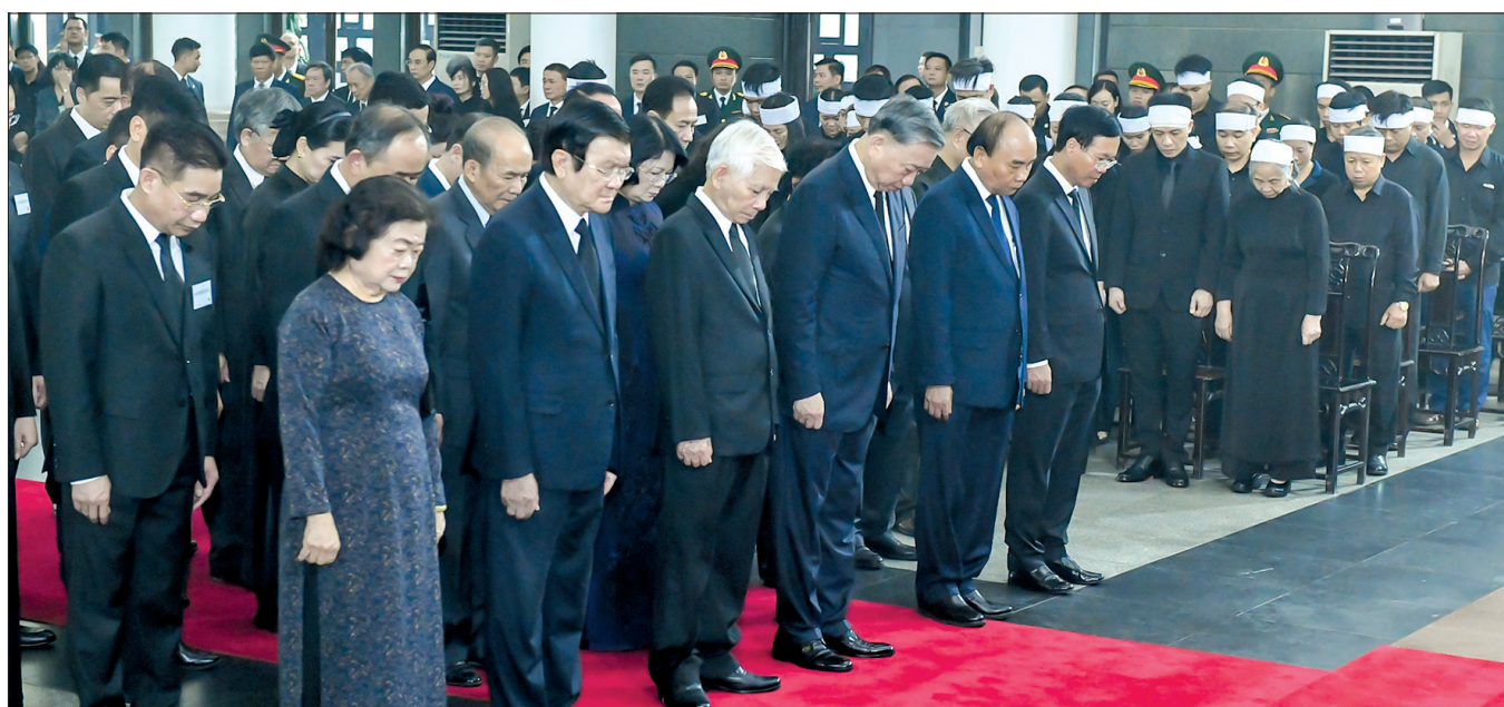
Đoàn Chủ tịch nước Cộng hòa xã hội chủ nghĩa Việt Nam do đồng chí Tô Lâm, Ủy viên Bộ Chính trị, Chủ tịch nước làm Trưởng đoàn viếng Tổng Bí thư Nguyễn Phú Trọng.