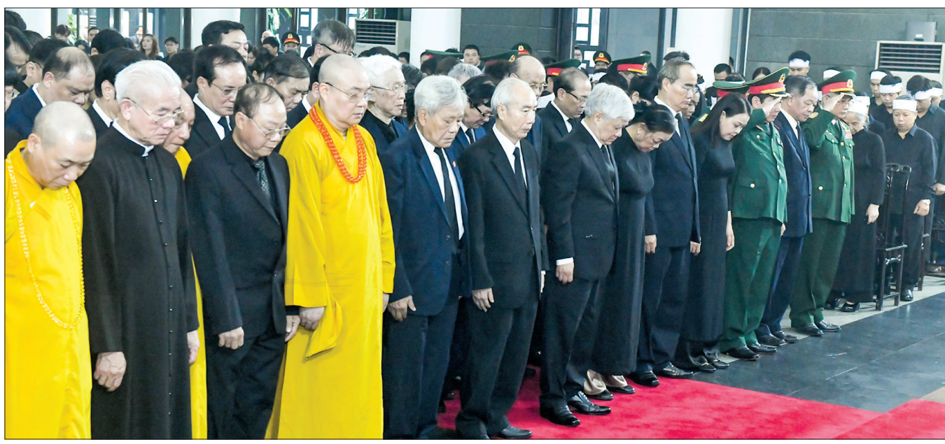
Đoàn Ủy ban Trung ương Mặt trận Tổ quốc Việt Nam do đồng chí Đỗ Văn Chiến, Ủy viên Bộ Chính trị, Bí thư Trung ương Đảng, Chủ tịch Ủy ban Trung ương Mặt trận Tổ quốc Việt Nam làm Trưởng đoàn viếng Tổng Bí thư Nguyễn Phú Trọng.