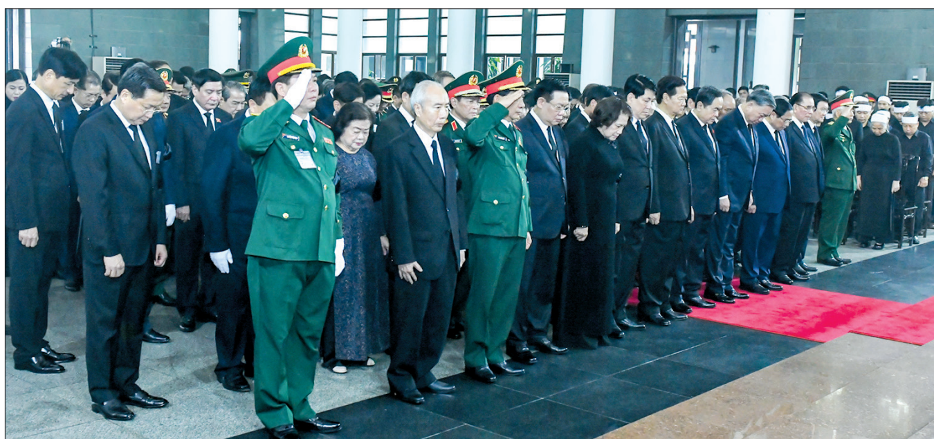
Đoàn Ban Chấp hành Trung ương Đảng Cộng sản Việt Nam do đồng chí Tô Lâm, Ủy viên Bộ Chính trị, Chủ tịch nước Cộng hòa xã hội chủ nghĩa Việt Nam làm Trưởng đoàn viếng Tổng Bí thư Nguyễn Phú Trọng.