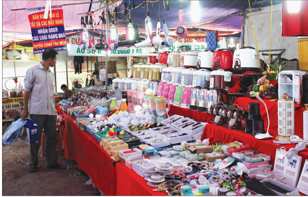
Các mặt hàng tiêu dùng thiết yếu phục vụ nhu cầu của người dân tại chợ xã Tây Giang (Tiên Hải).

Sau hơn 10 năm thực hiện chương trình xây dựng nông thôn mới, huyện Tiên Hải đã chỉ đạo các địa phương cải tạo, xây mới chợ nông thôn nhằm hỗ trợ phát triển sản xuất, kinh doanh, nâng cao đời sống nhân dân.