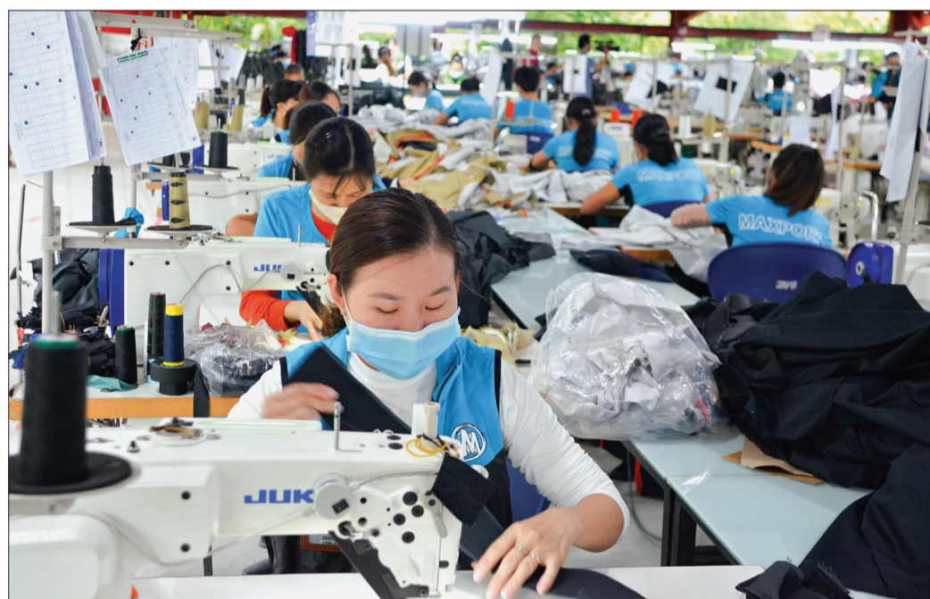
Công ty TNHH Maxport Limited Việt Nam luôn quan tâm chăm lo đời sống vật chất, tinh thần cho người lao động.