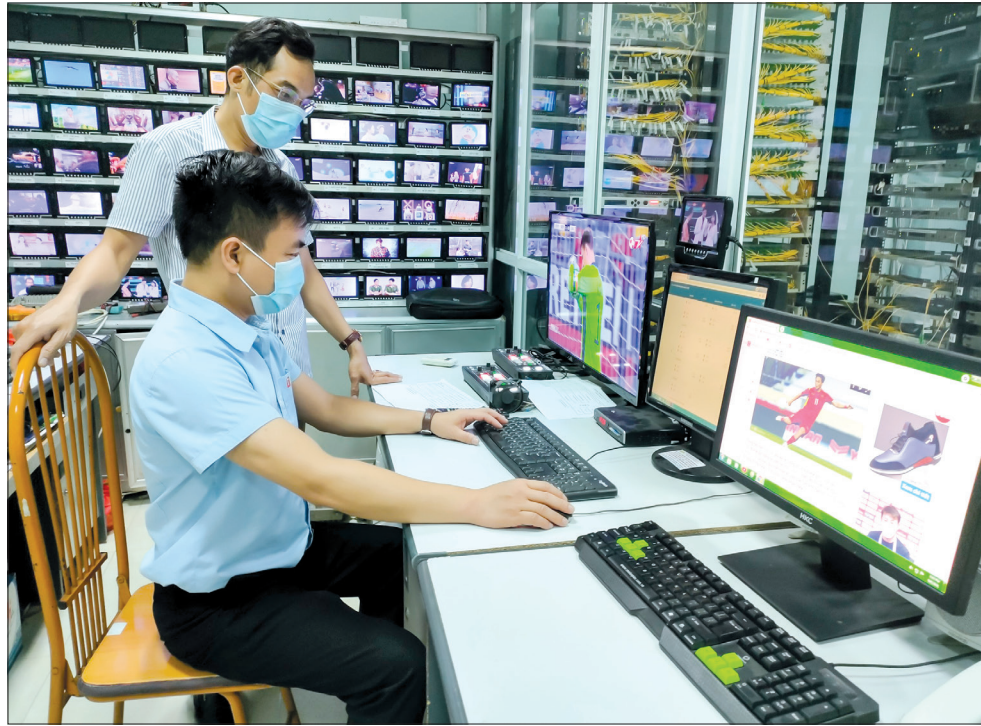
Cán bộ Trung tâm Truyền hình cáp Thái Bình kiểm tra chất lượng đường truyền sẵn sàng tiếp sóng EURO 2020.