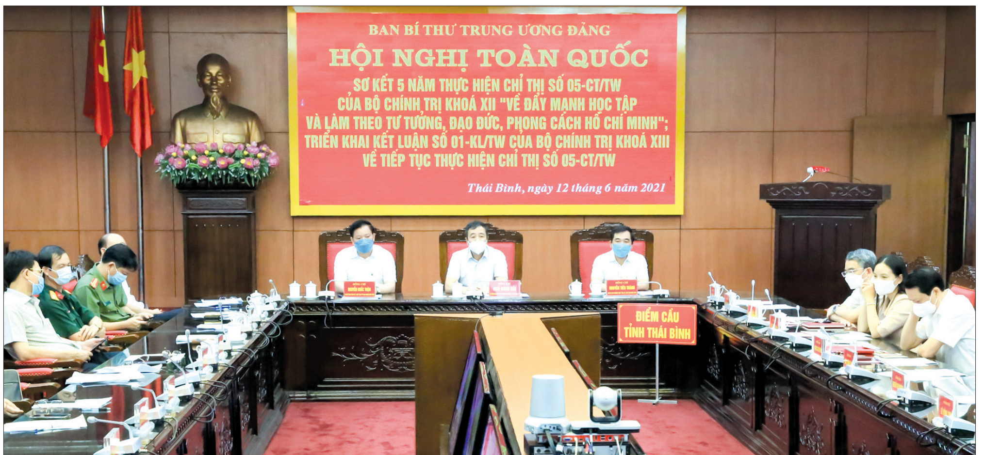
Các đồng chí Thường trực Tỉnh ủy và đại biểu dự hội nghị tại điểm cầu Tỉnh ủy Thái Bình.