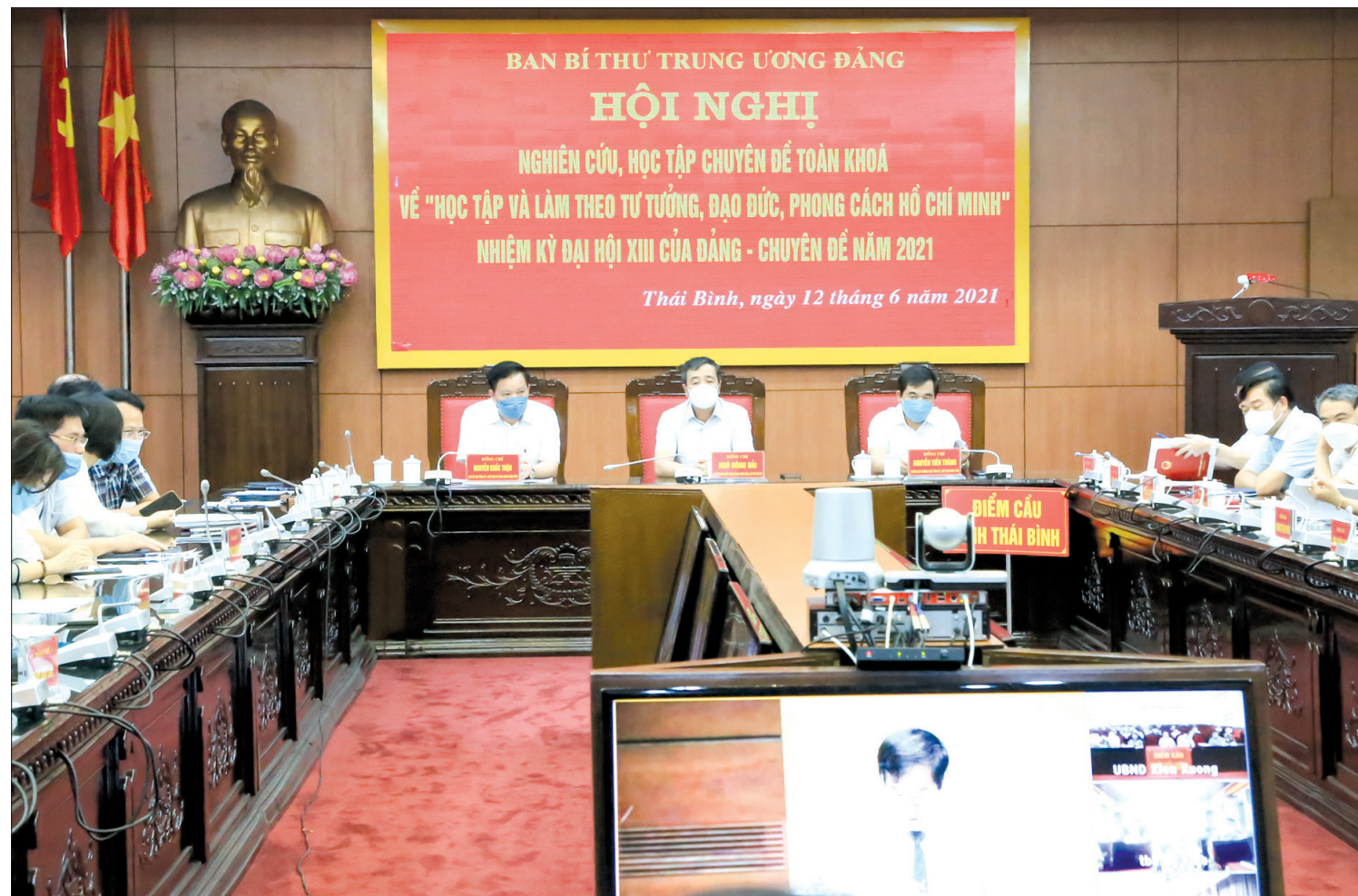
Các đồng chí Thường trực Tỉnh ủy và đại biểu dự hội nghị tại điểm cầu Tỉnh ủy Thái Bình.