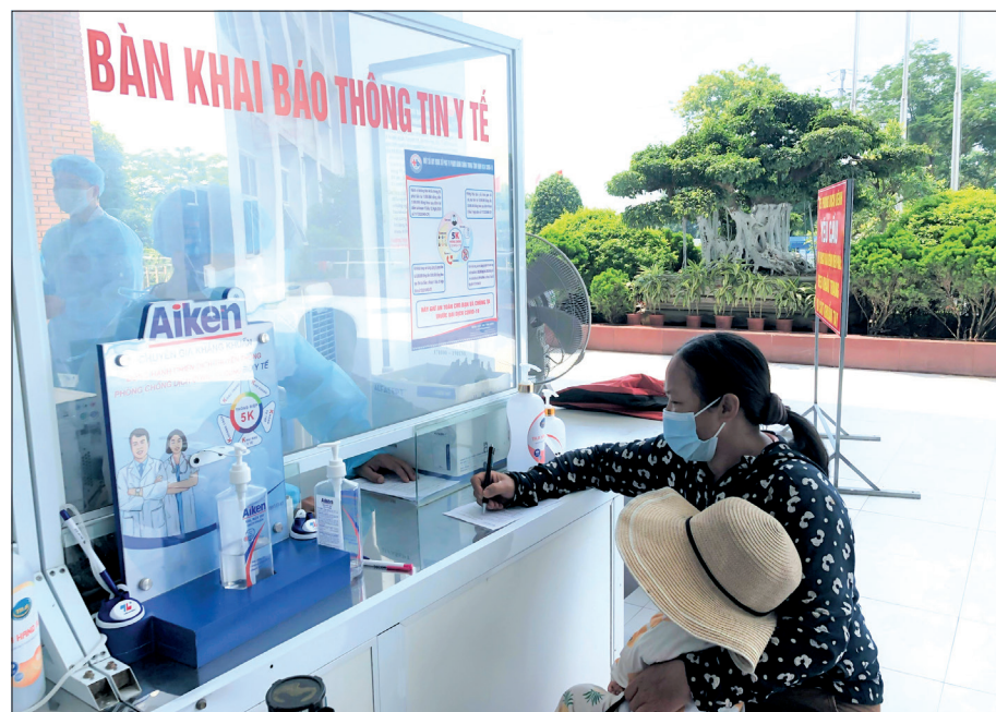
Cán bộ y tế Bệnh viện Nhi Thái Bình hướng dẫn người nhà bệnh nhân khai báo y tế.