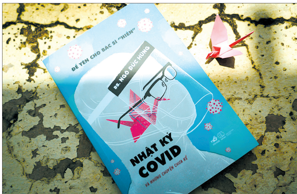
Bút ký "Để yên cho bác sĩ "hiền" - Nhật ký Covid và những chuyện chưa kể" của bác sĩ Ngô Đức Hùng.

(nhandan.vn) Giữa những tháng ngày đáng nhớ khi cả nước đang căng mình chống dịch, những dòng ghi chép của bác sĩ Ngô Đức Hùng (Khoa Hồi sức Cấp cứu, Bệnh viện Bạch Mai, Hà Nội) cho chúng ta thấy những suy tư, trăn trở nhưng cũng đầy hài hước và hy vọng. Những dòng ghi chép này đã được Nhà Nam xuất bản trong tập bút ký "Để yên cho bác sĩ "hiền" - Nhật ký Covid và những chuyện chưa kể".