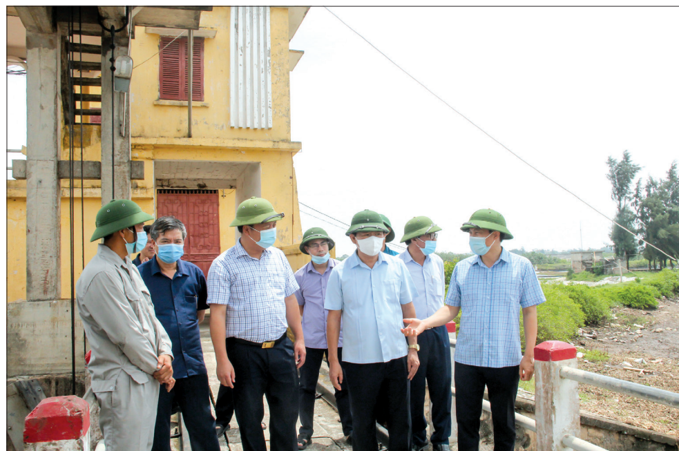
Đồng chí Lại Văn Hoàn, Tỉnh ủy viên, Phó Chủ tịch UBND tỉnh, Phó Trưởng ban thường trực Ban Chỉ huy phòng, chống thiên tai và tìm kiếm cứu nạn tỉnh kiểm tra công tác vận hành, điều tiết nước tại cống Lân I (Tiên Hải).

Để chủ động ứng phó với ATNĐ ngay từ giờ đầu, Ban Chỉ huy PCTT và TKCN tỉnh đã ban hành Công điện số 01/CĐ-PCTT hồi 13 giờ 30 phút ngày 11/6/2021, Công điện số 02/CĐ-PCTT hồi 06 giờ 00 phút ngày 12/6/2021.