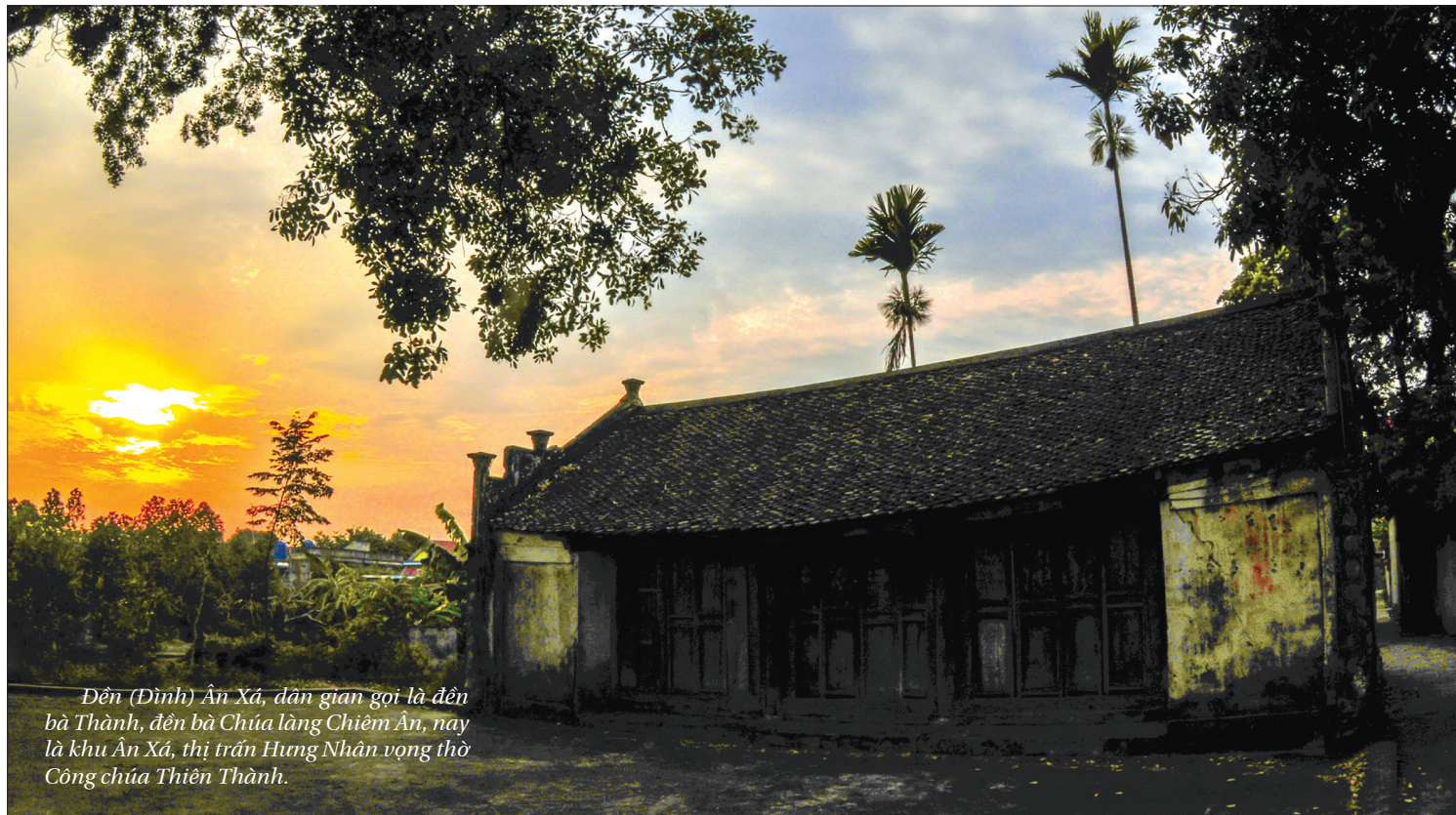
Đền (Đình) Ân Xá, dân gian gọi là đền bà Thành, đền bà Chúa làng Chiêm Ân, nay là khu Ân Xá, thị trấn Hưng Nhân vọng thờ Công chúa Thiên Thành.

Sử cũ chép, khi công chúa Thiên Thành (trưởng công chúa của vua Trần Thái Tông, vợ Hưng Đạo Vương Trần Quốc Tuấn) mất, vua Trần Anh Tông đích thân đến tế lễ, lại cấp sắc và ban bổng lộc cho dân làng ở những địa danh công chúa Thiên Thành từng lưu lại và từng giúp dân lập ấp, dựng làng (trong đó có làng Chiêm Ân, tổng Đặng Xá, huyện Ngự Thiên, phủ Long Hưng nay là khu Ân Xá, thị trấn Hưng Nhân, huyện Hưng Hà) được phép dựng đền thờ bà. Vua phong bà duệ hiệu “Nguyễn Từ Quốc Mẫu”. Các triều đại phong kiến kế tiếp nối đời đều sắc phong thần liệt vào bậc “Trung đẳng thần”.