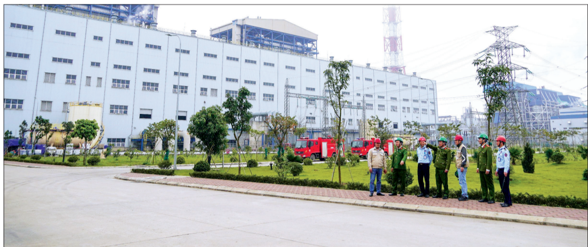
Đồn Công an bảo vệ Trung tâm Điện lực Thái Bình phối hợp với Nhà máy nhiệt điện Thái Bình 2 thực hiện tuần tra bảo đảm an ninh trật tự.

Phát huy truyền thống Công an nhân dân "Vì nước quên thân, vì dân phục vụ", những năm qua, Đồn Công an bảo vệ Trung tâm Điện lực (BVTTLĐ) Thái Bình luôn hoàn thành xuất sắc nhiệm vụ được giao, giữ vững an ninh trật tự (ANTT) giúp nhà đầu tư, doanh nghiệp, công nhân yên tâm lao động sản xuất.