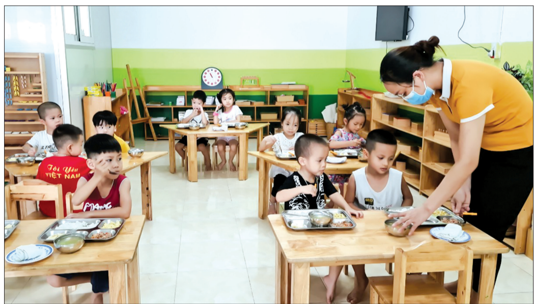
Bữa ăn trưa tại nhóm lớp mầm non Smartkid.

Thành phố Thái Bình hiện có 30 trường mầm non và hàng chục nhóm trẻ với trên 12.100 học sinh. Để bảo đảm dinh dưỡng và vệ sinh an toàn thực phẩm (VSATTP) trong các bữa ăn bán trú, ngành Giáo dục và Đào tạo đã chỉ đạo các trường mầm non thực hiện nghiêm các quy định, các biện pháp phòng, chống dịch Covid-19.