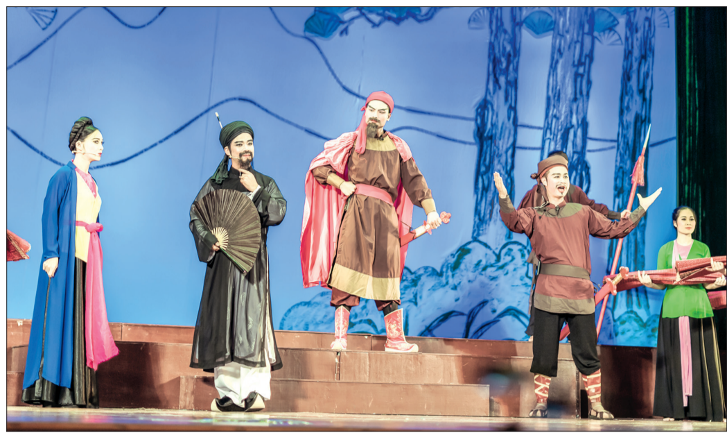
Vở chèo "Trộn nghĩa non sông" của Nhà hát Chèo Thái Bình đạt huy chương vàng tại liên hoan chèo toàn quốc năm 2019.

KỶ 3: HỒI SINH KHÔNG GIAN NGHỆ THUẬT TRUYỀN THỐNG GIỮA DÒNG CHẢY ĐƯƠNG ĐẠI