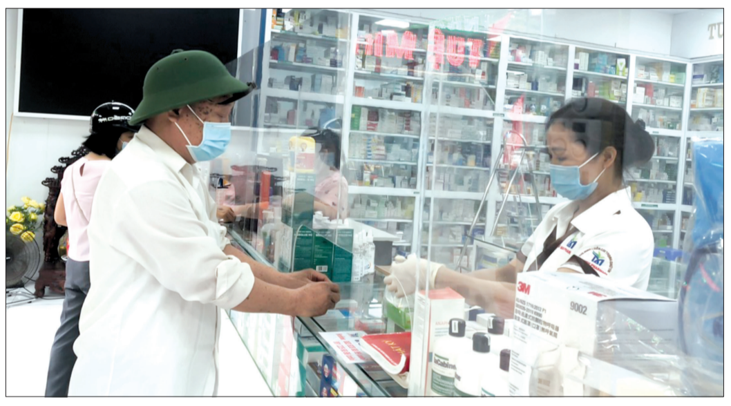
Người dân mua thuốc tại nhà thuốc Tuệ Minh (thành phố Thái Bình).