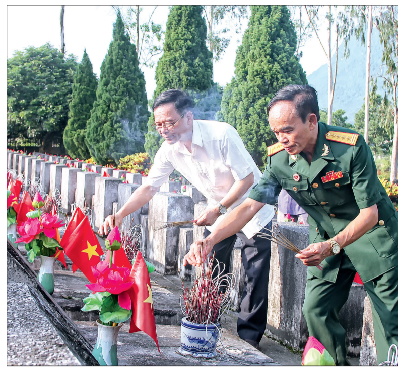
Các đại biểu thấp hương tưởng niệm các anh hùng liệt sĩ tại Nghĩa trang Liệt sĩ quốc gia Vị Xuyên.

Trong không khí trang nghiêm, đoàn đại biểu tỉnh Thái Bình đã đặt vòng hoa của Tỉnh ủy, HĐND, UBND, Ủy ban MTTQ tỉnh, thành kính dâng hương, dâng một phút mặc niệm các anh hùng liệt sĩ đã ngã xuống vì nền độc lập, tự do của dân tộc.