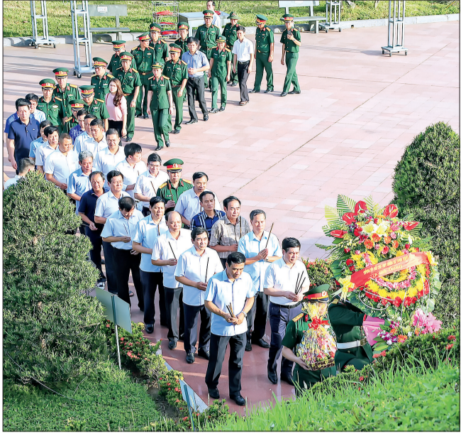
Các đồng chí lãnh đạo tỉnh dâng hương tưởng niệm các anh hùng liệt sĩ tại Di tích quốc gia đặc biệt Thành cổ Quảng Trị.