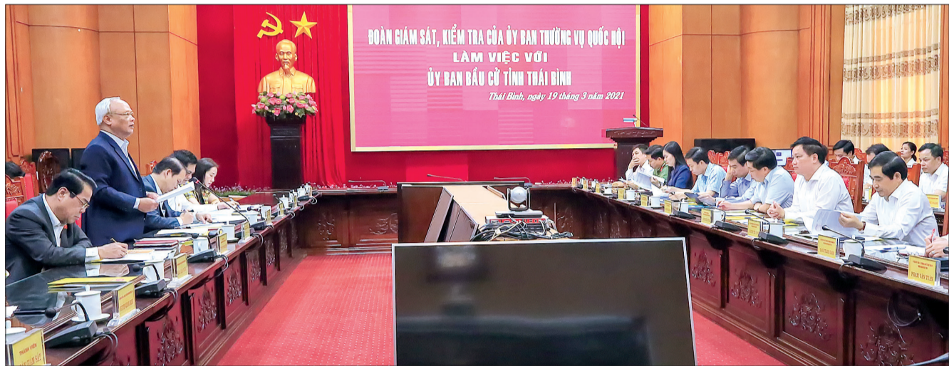
Đồng chí Ông Chu Lưu, Phó Chủ tịch Quốc hội, Ủy viên Hội đồng bầu cử quốc gia phát biểu tại buổi làm việc.