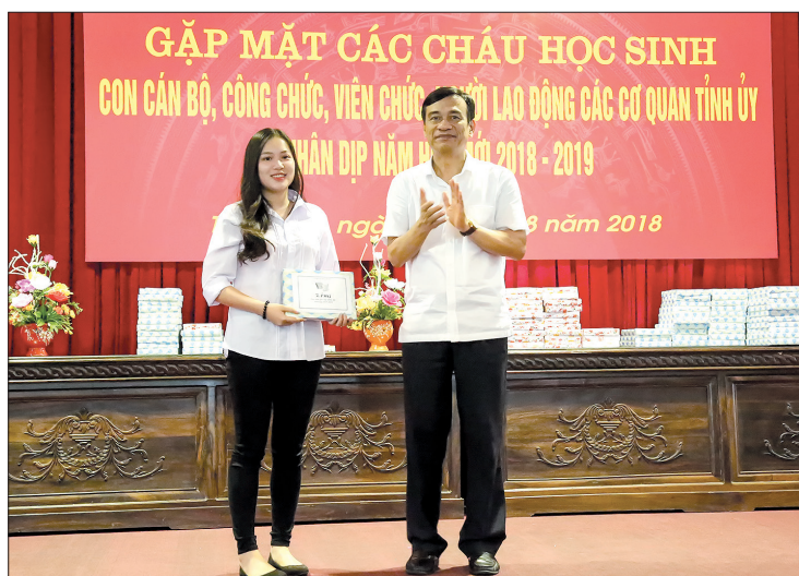
Đồng chí Đặng Trọng Thăng, Phó Bí thư thường trực Tỉnh ủy, Chủ tịch UBND tỉnh trao phần thưởng học sinh giỏi cấp quốc gia.