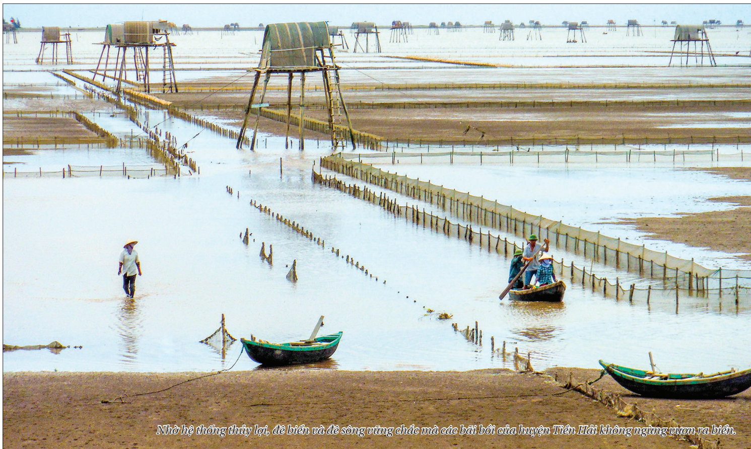
Nhờ hệ thống thủy lợi, đê biển và đê sông vững chắc mà các bãi bồi của huyện Tiên Hải không ngừng vươn ra biển.