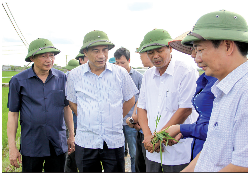
Đồng chí Đặng Trọng Thăng, Phó Bí thư thường trực Tỉnh ủy, Chủ tịch UBND tỉnh kiểm tra sản xuất nông nghiệp tại xã Thái Sơn (Thái Thụy).

Chiều ngày 4/8, đồng chí Đặng Trọng Thăng, Phó Bí thư thường trực Tỉnh ủy, Chủ tịch UBND tỉnh đi kiểm tra, chỉ đạo sản xuất nông nghiệp tại hai huyện Thái Thụy, Kiến Xương. Cùng đi có đồng chí Hà Công Toàn, Ủy viên Ban Thường vụ, Chủ nhiệm Ủy ban Kiểm tra Tỉnh ủy; lãnh đạo Sở Nông nghiệp và Phát triển nông thôn.