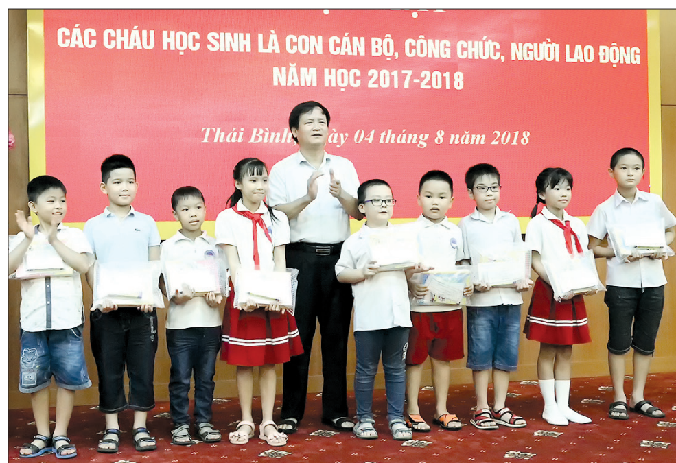
Lãnh đạo Văn phòng Tỉnh ủy trao phần thưởng cho các cháu học sinh giỏi năm học 2017 - 2018.

Để kịp thời động viên, khích lệ các cháu tiếp tục vươn lên trong học tập, Ban biên tập và Công đoàn cơ quan Báo Thái Bình đã tặng quà, động viên khích lệ các cháu với mong muốn các cháu trong năm học mới tiếp tục nỗ lực cố gắng, đạt nhiều thành tích cao hơn nữa trong học tập, rèn luyện để tiếp nối truyền thống hiếu học của gia đình và của cơ quan Báo Thái Bình.