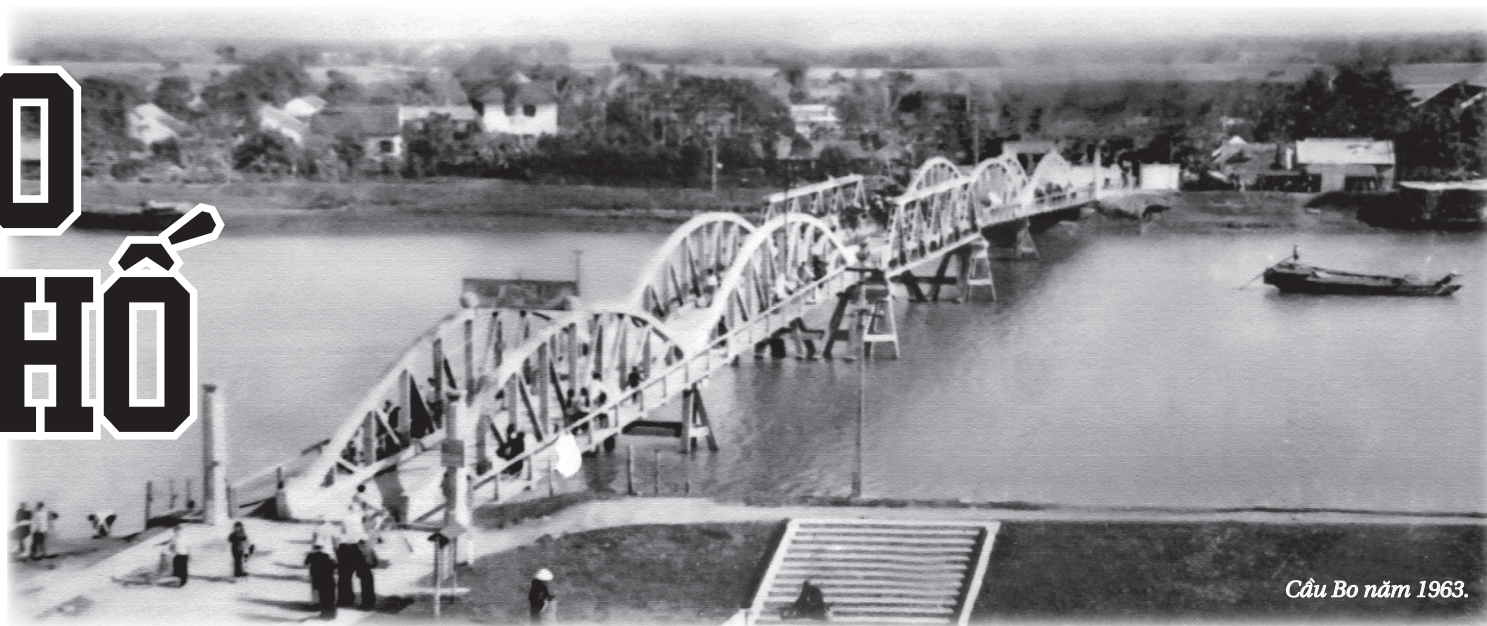
Cầu Bo năm 1963.

Có lần Giản được ai cho chiếc bánh bao nóng. Bánh trắng ngồn ngồn, tròn như “báu vật”. Á đâu có ăn? Mặt ả đỏ lên. Hai tay bóp bóp, nắm nắm, ngồi nghịch bánh như đứa trẻ ngồi vắn vú mẹ. Sơn què thấy ả làm vậy chỉ biết cười, rồi tấp tểnh lê bước chân trên chợ.