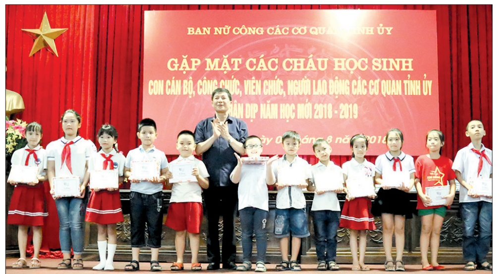
Đồng chí Hà Công Toàn, Ủy viên Ban Thường vụ, Chủ nhiệm Ủy ban Kiểm tra Tỉnh ủy trao phần thưởng cho các cháu học sinh giỏi cấp trường bậc tiểu học.

Sáng ngày 4/8, Ban nữ công các cơ quan Tỉnh ủy tổ chức gặp mặt các cháu học sinh con cán bộ, công chức, viên chức, người lao động các cơ quan Tỉnh ủy nhân dịp chuẩn bị bước vào năm học mới 2018 - 2019. Dự buổi gặp mặt có đồng chí Đặng Trọng Thăng, Phó Bí thư thường trực Tỉnh ủy, Chủ tịch UBND tỉnh; lãnh đạo các cơ quan Tỉnh ủy và các bậc phụ huynh.