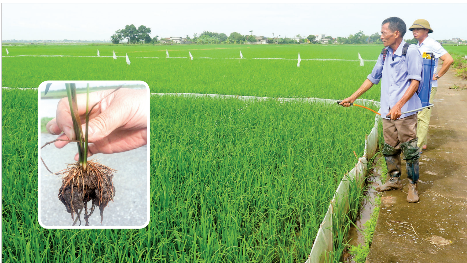
Nông dân xã Lê Lợi (Kiến Xương) phun thuốc trừ rầy hại lúa.