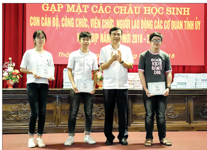
Đồng chí Đặng Trọng Thăng, Phó Bí thư thường trực Tỉnh ủy, Chủ tịch UBND tỉnh trao phần thưởng cho các cháu học sinh đỗ đại học.