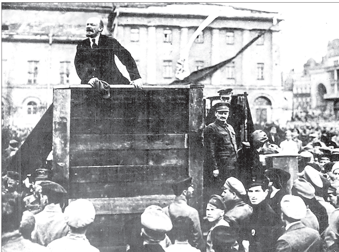
Lãnh tụ V.I.Lênin phát biểu trước đám đông trên Quảng trường Sverdlov ở Petrograd năm 1919. Ảnh tư liệu

Ví dụ như: Liên Xô đã vượt tới nhiều đỉnh cao về khoa học - công nghệ, đặc biệt đã mở ra kỷ nguyên của người chinh phục vũ trụ. Nền giáo dục Xô-viết đã được xếp vào hàng tiên tiến hàng đầu thế giới. Các lĩnh vực văn hóa, nghệ thuật... đã phát triển rực rỡ, hết sức phong phú,