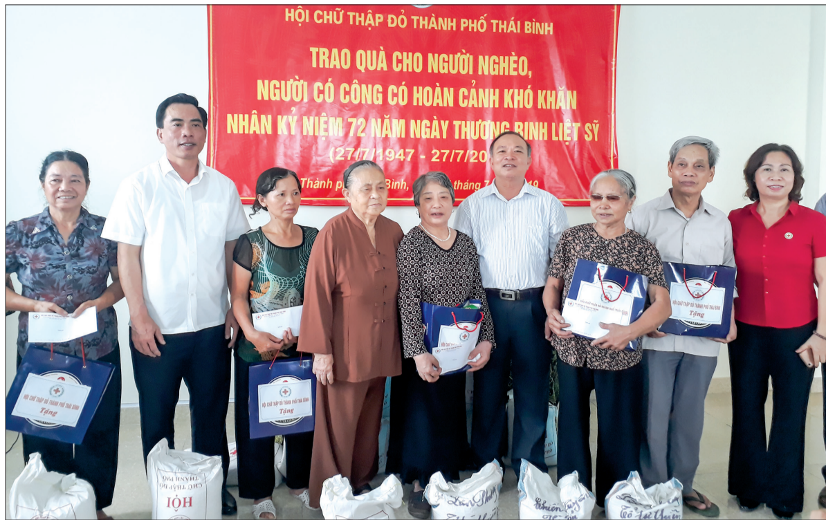
Hội Chữ thập đỏ thành phố trao quà cho người nghèo, người có công cố hoàn cảnh khó khăn.

Với mục tiêu tạo chuyển biến mạnh mẽ, toàn diện trong công tác giảm nghèo, phấn đấu giảm tỷ lệ hộ nghèo xuống dưới 1%, Ủy ban MTTQ thành phố và các cấp thường xuyên tuyên