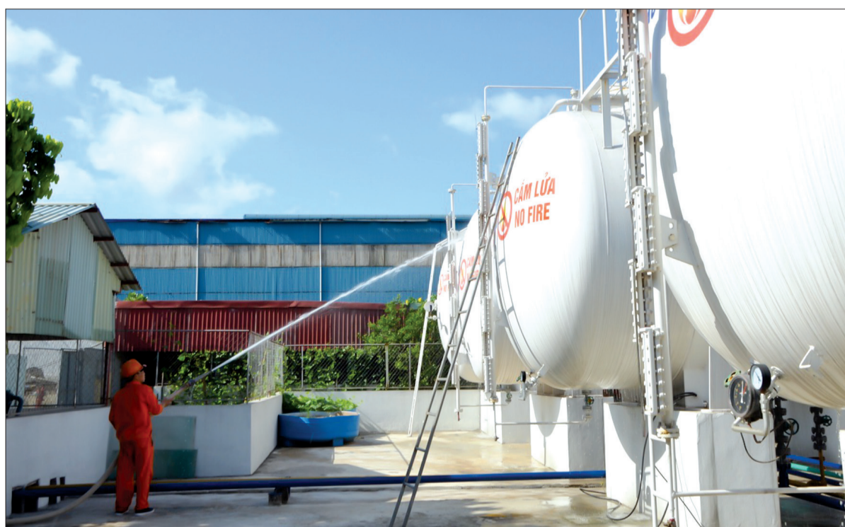
Công nhân bơm nước làm mát bồn chứa gas trong những ngày nắng nóng.

Bà Trần Thị Kim Tân, Chủ tịch Hội đồng quản trị Công ty cho biết: Công ty thành lập năm 2008, ngành nghề kinh doanh chính là chiết nạp khí đầu mỏ hóa lỏng phục vụ nhu cầu sử dụng gas dân dụng và cung cấp các sản phẩm gas công nghiệp để phục vụ sản xuất, kinh doanh cho các doanh nghiệp trong và ngoài tỉnh. Sang chiết gas là ngành nghề có yêu cầu cao về bảo đảm an toàn vệ sinh lao động, đặc biệt là phòng, chống cháy, nổ. Với phương châm “Phòng cháy hơn chữa cháy” nên ngay từ khi bắt tay vào xây dựng Công ty đã đầu tư các máy móc hiện đại, công nghệ cao, trong đó có hệ thống cảnh báo rò rỉ gas tự động và báo cháy tự