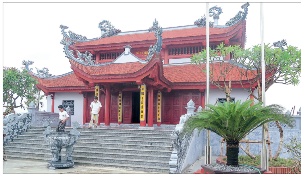
Đền thờ liệt sĩ xã Vũ Trung.

Chủ tịch UBND xã Ngô Văn Xuân cho biết: Trong hai cuộc kháng chiến giải phóng dân tộc và bảo vệ Tổ quốc, Vũ Trung có trên 2.000 người tham gia chiến đấu ở khắp các mặt trận và làm nhiệm vụ quốc tế tại nước bạn Lào và Campuchia. Kết thúc các cuộc kháng chiến, xã có 27 người được phong tặng, truy tặng danh hiệu anh hùng, 208 liệt sĩ, 152 thương binh, bệnh binh, 110 nạn nhân chất độc da cam/Đioxin, hàng trăm gia đình có công với nước. Để tỏ lòng thành kính, biết ơn những người đã hy sinh hoặc để lại một phần xương máu của mình nơi chiến trường, những năm qua, xã đã hỗ trợ xây mới, sửa chữa 19 nhà tình nghĩa với số tiền 720 triệu đồng. Ngoài các chế độ, chính sách của