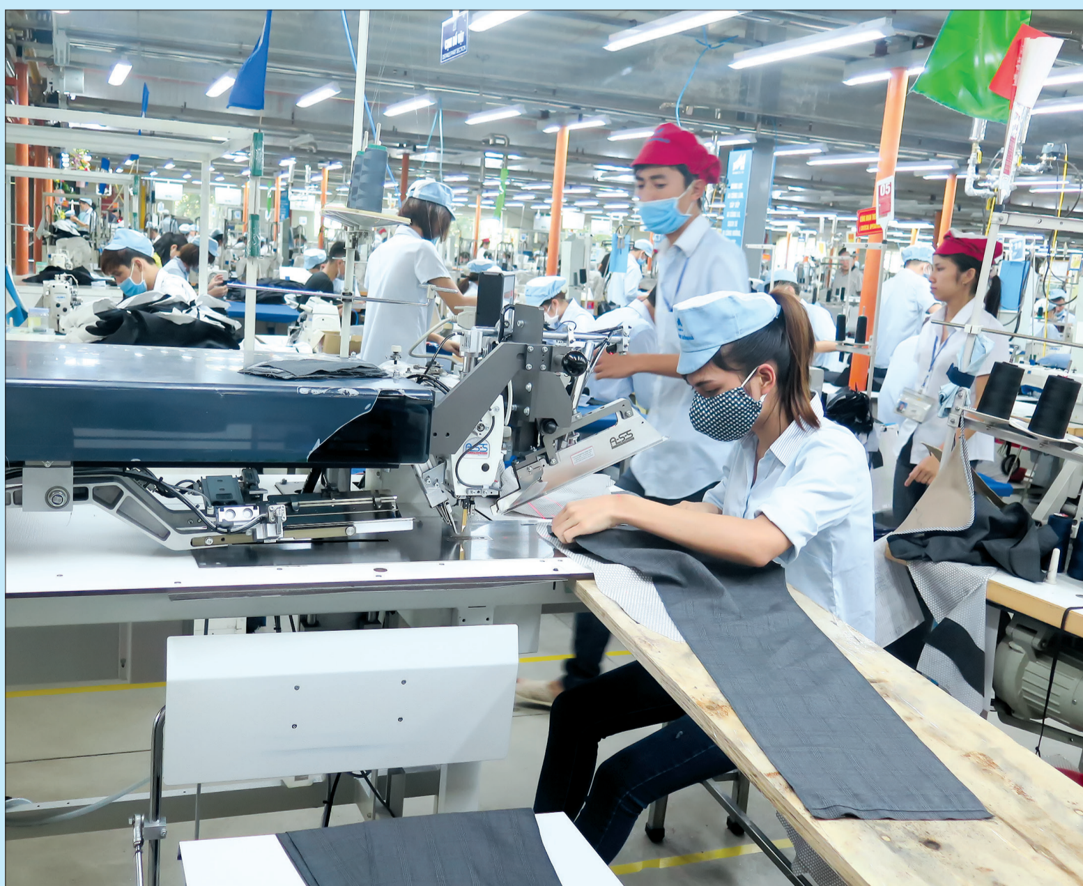
Dây chuyền sản xuất của Xí nghiệp Veston Hưng Hà.