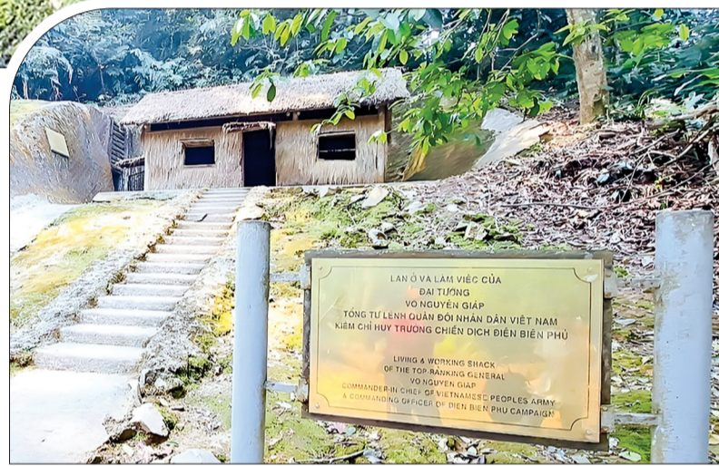
Nơi ở và làm việc của Đại tướng Võ Nguyên Giáp trong chiến dịch Điện Biên Phủ.

56 ngày đêm "khoét núi, ngủ hầm, mưa dầm, cơm vắt, máu trộn bùn non", chiến đấu dũng cảm, mưu trí, sáng tạo, quân và dân ta đã đập tan hoàn toàn tập đoàn cứ điểm - pháo đài "bất khả xâm phạm" của thực dân Pháp tiêu diệt và bắt sống toàn bộ quân địch. Bộ chỉ huy chiến dịch đã thực hiện xuất sắc nhiệm vụ chỉ đạo, chỉ huy, điều hành chiến dịch mà Đảng, Bác Hồ giao phó, giành thắng lợi vang dội, kết thúc 9 năm kháng chiến trường kỳ chống thực dân Pháp. Ông Từ Quang Kiên, thành phố Nha Trang (Khánh Hòa) chia sẻ: Nơi đầu tiên tôi và đoàn cựu chiến binh (CCB) của thành phố Nha Trang đến thăm là Sở chỉ huy chiến dịch Điện Biên Phủ. Đến đây được tham quan từng