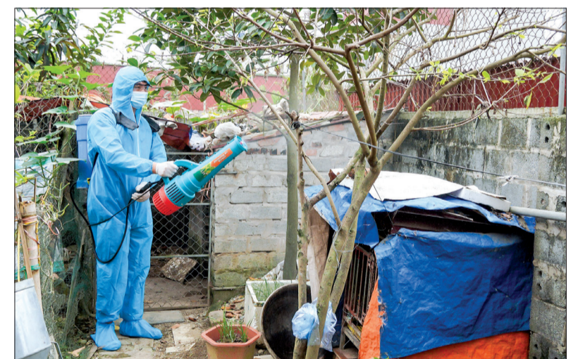
Phun thuốc khử khuẩn phòng, chống bệnh truyền nhiễm.

Chú trọng công tác phòng, chống dịch bệnh trong trường học, quý I/2024 Trung tâm Y tế huyện Thái Thụy phối hợp