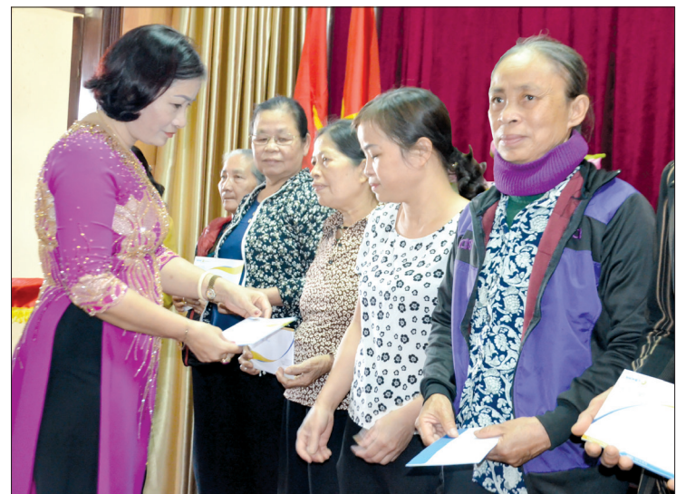
Hội Liên hiệp Phụ nữ thành phố tặng quà hội viên có hoàn cảnh khó khăn.