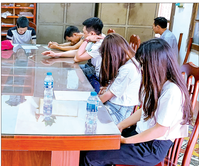
Các đối tượng sử dụng ma túy tổng hợp bị bắt giữ.