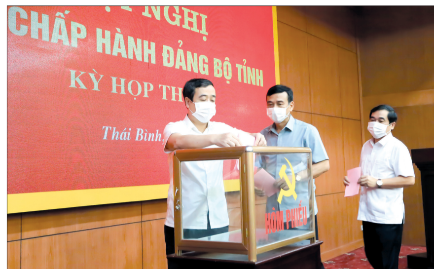
Các đồng chí Thường trực Tỉnh ủy bỏ phiếu giới thiệu nhân sự.