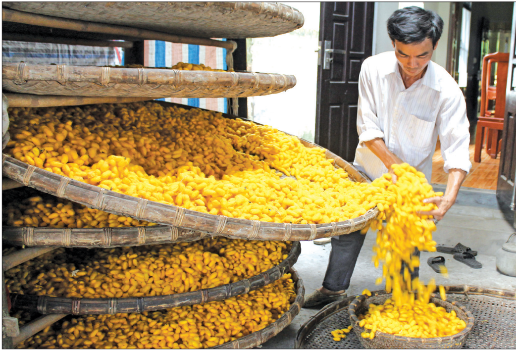
Nông dân xã Hồng Lý (Vũ Thư) duy trì nghề trồng đậu nuôi tằm truyền thống.

Triển khai chương trình hành động, sớm đưa nghị quyết vào cuộc sống là điều được cán bộ, đảng viên, nhân dân quan tâm sau mỗi kỳ đại hội. Tại Vũ Thư, ngay từ những tháng đầu của nhiệm kỳ, cấp ủy, chính quyền các cấp đã khẩn trương triển khai các giải pháp, bắt tay vào thực hiện nhằm sớm đưa nghị quyết Đại hội Đảng bộ huyện nhiệm kỳ 2020 - 2025 vào cuộc sống, trong đó huyện đặc biệt chú trọng triển khai nghị quyết về xây dựng nông thôn mới (NTM) nâng cao, NTM kiểu mẫu. Đại hội Đảng bộ xã Nguyễn Xá nhiệm kỳ 2020 - 2025 ban hành nghị quyết và đề ra nhiều mục tiêu, trong đó có mục tiêu trở thành xã NTM nâng cao, giai đoạn 2020 - 2025. Tuy nhiên, sau Đại hội Đảng bộ huyện, Nguyễn Xá được huyện tin tưởng chọn là xã tiên phong xây dựng và về đích NTM nâng cao ngay trong