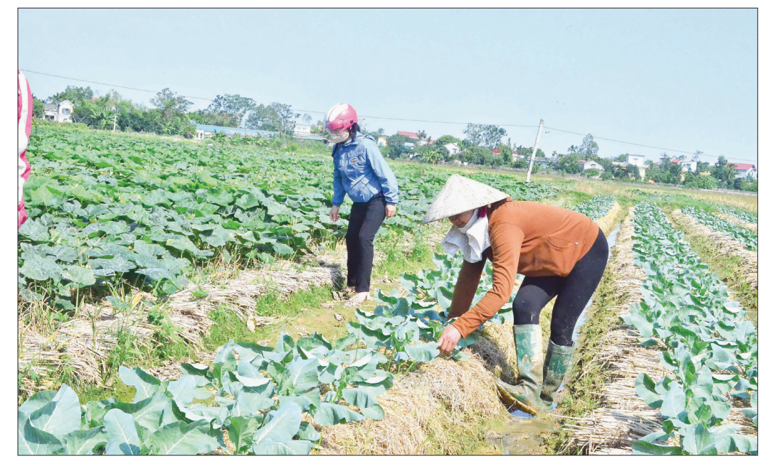
Phụ nữ xã Duyên Hải (Hưng Hà) chăm sóc rau màu vụ đông.