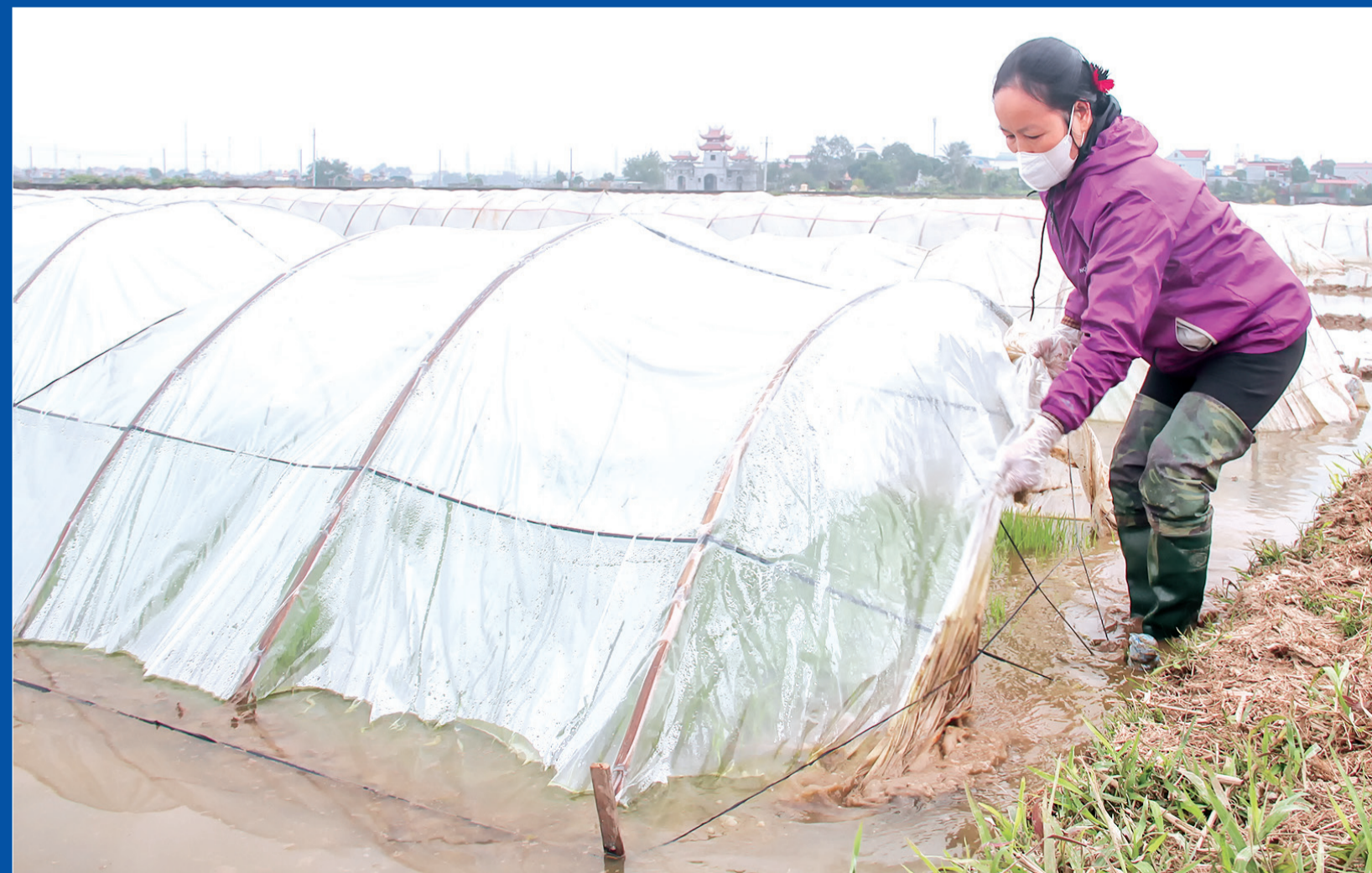
Ngành nông nghiệp khuyến cáo chống rét cho những diện tích mạ đã gieo bằng các biện pháp như che phủ bằng nilon trắng, bảo đảm đủ nước cho mạ, tuyệt đối không để khô hạn.