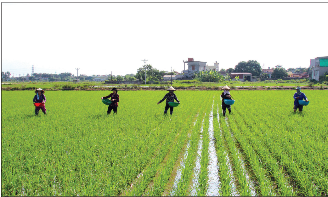
Chị Phạm Thị Thủy, thôn Lam Điền, xã Đông Động tích tụ 30 mẫu ruộng cấy lúa hàng hóa, thu mỗi năm 600 triệu đồng.

Với khẩu hiệu "Ở đâu có phụ nữ, ở đó có phong trào", 5 năm qua, Hội Liên hiệp Phụ nữ (LHPN) xã Đông Động (Đông Hưng) đã không ngừng đổi mới về nội dung, phương thức hoạt động, vận dụng sáng tạo nội dung các phong trào thi đua yêu nước phù hợp với từng chi hội, từng thời điểm, góp phần xây dựng tổ chức hội