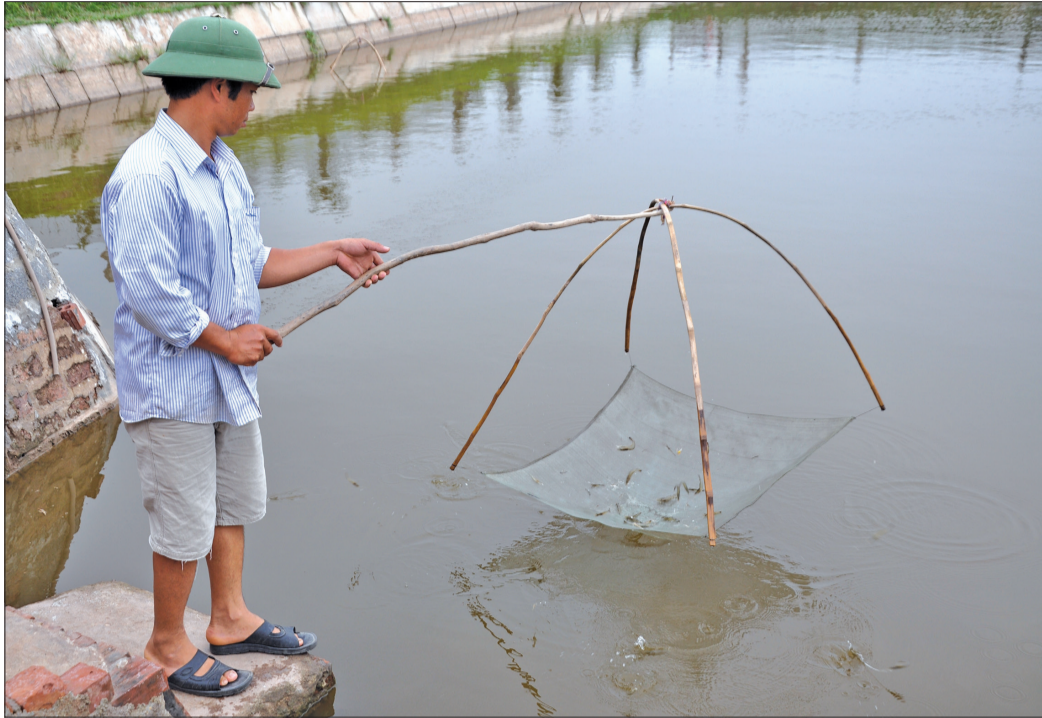
Hộ nuôi trồng thủy sản xã Thụy Xuân (Thái Thụy) kiểm tra sự sinh trưởng, phát triển của tôm nuôi.

Hiện nay đang vào mùa mưa bão, thời tiết, nhiệt độ thay đổi tạo điều kiện cho dịch bệnh phát tán, lây lan, ảnh hưởng lớn đến sự sinh trưởng và phát triển của thủy sản. Không những vậy, mưa bão còn gây nguy cơ tràn bờ, thất thoát thủy sản; do đó, để tránh thiệt hại, các hộ nuôi trồng thủy sản trên địa bàn huyện Thái Thụy đã và đang chủ động các biện pháp bảo vệ, chăm sóc thủy sản.