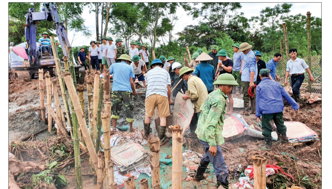
Khắc phục sự cố sạt lở bờ bao đê hữu Hóa thuộc địa phận xã An Ninh (Quỳnh Phụ).