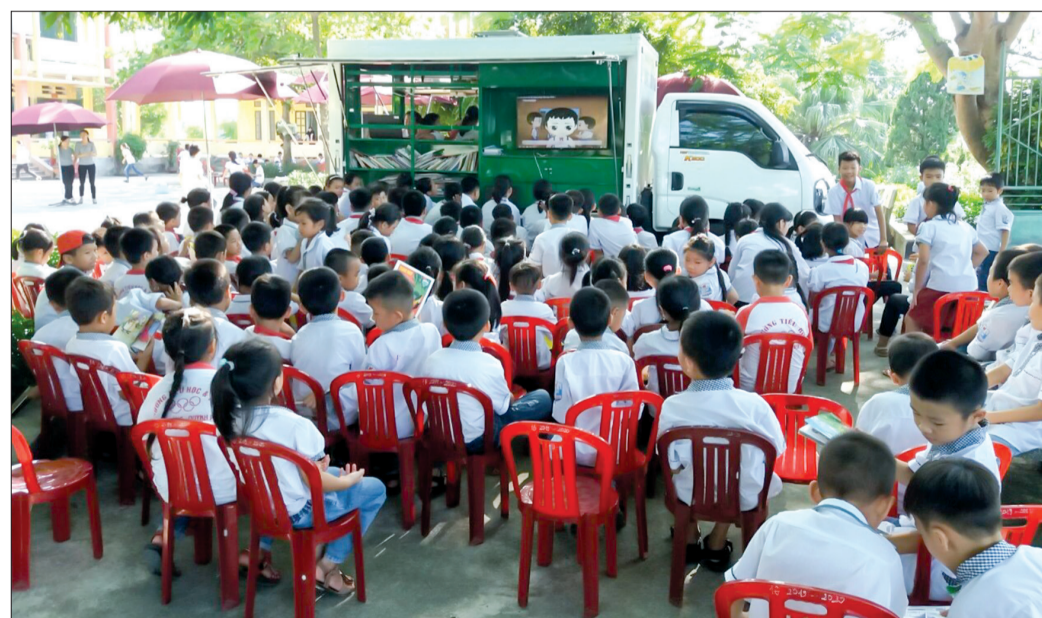
Ngoài đọc sách, học sinh tại các điểm trường còn được tiếp cận với các trang thiết bị trên xe ô tô thư viện lưu động như tivi, máy tính, máy chiếu...

viện lưu động đầu tiên lần bánh đến với Trường Tiểu học An Vinh (Quỳnh Phụ). Tuy có thời gian phải tạm dừng hoạt động bởi ảnh hưởng của dịch Covid-19 nhưng chuyến xe đến với Trường Tiểu học và THCS An Dục là chuyến xe thứ 14. Riêng trong tháng 6, xe ô tô thư viện đa phương tiện đã đến với 5 điểm trường mang đến cho các em học sinh những giờ đọc sách bổ ích, lý thú. Hạnh phúc lớn nhất đối với mỗi cán bộ của Thư viện Khoa học tổng hợp tỉnh là tại điểm trường nào cũng nhận được sự đón nhận nồng nhiệt của các thầy cô giáo, các em học sinh và các bậc phụ huynh.