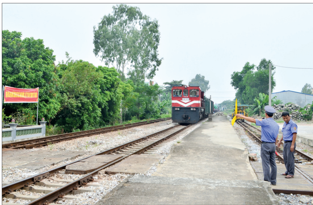
Ga Núi Gôi (Nam Định) ngày nay.

T rong kháng chiến chống Mỹ, ga núi Gôi là khu tập kết hàng hóa để chuyển vào chiến trường. Chính vì vậy, đây là một trong các trọng điểm oanh tạc của máy bay Mỹ. Một trong những lần mà ta bị thiệt hại nặng nề nhất là ngày 20/8/1966. Về thăm lại nơi mình và đồng đội đã chiến đấu, sư thầy Thích Đàm Đoàn, cựu TNXP Đại đội 895, Đại đội 89 nghẹn ngào kể lại: Vào khoảng 17 giờ ngày 20/8/1966, địch cho một tốp máy bay bất ngờ bắn phá đoàn tàu vừa đến ga Gôi đang chờ lệnh vượt cầu Ninh Bình để đưa vũ khí, hàng hóa vào chiến trường. Một số toa của đoàn tàu đang cháy dữ dội. Toa hàng hóa, gạo đổ tràn ra ngoài. Gần đầu tàu có một toa cũng đang cháy, khói da cam mờ xanh từ đó bốc lên mù mịt và nóng nực. Không một giây lưỡng lự, TNXP Đại đội 895, Đại đội 89 cùng với các lực lượng có mặt lao vào bốc hàng và dập đám cháy. Biết nguy hiểm, có thể hy sinh nhưng chúng tôi vẫn xông lên cứu đoàn tàu. Anh chị em hy sinh nằm lại đây là 13 đồng chí. Sau hơn 50 năm trở lại chiến trường cũ, chúng tôi rất cảm động. Anh chị em lúc đó có 17, 18 tuổi. Chúng tôi được như thế này rất cảm động, thương các anh, các chị tuổi còn