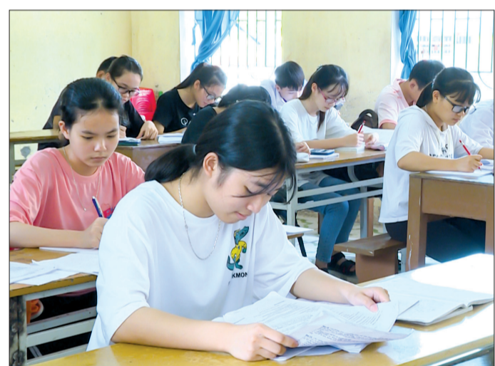
Tiết ôn tập của học sinh lớp 9, Trường Tiểu học và THCS Vũ Lăng (Tiên Hải).