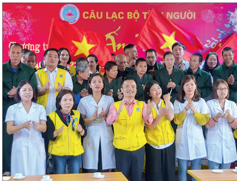
Câu lạc bộ tình người giao lưu cùng cán bộ và bệnh nhân Trung tâm Chăm sóc và Phục hồi chức năng cho người tâm thần.

Những ngày giao tết Nguyên đán Canh Tý 2020, khắp nơi trên địa bàn tỉnh diễn ra nhiều hoạt động thăm hỏi, tặng quà tết cho người có công, người có hoàn cảnh khó khăn. Tại Trung tâm Chăm sóc và Phục hồi chức năng cho người tâm thần, không khí tết nơi đây đang đến rất gần. Mặc dù cách thành phố Thái Bình hơn 100km nhưng ngay từ đầu giờ sáng ngày 7/1, hơn 80 thành viên Câu lạc bộ tình người ở Hà Nội đã có mặt tại Trung tâm Trung tâm Chăm sóc và Phục hồi chức năng cho người tâm thần. Mong muốn được thăm hỏi, động viên và sẻ chia với những đau đớn cùng người bệnh nên rất nhiều phần quà được các thành viên chuẩn bị. Bánh kẹo, đồ dùng cá nhân là những món quà không thể thiếu trong mỗi chuyến đi của đoàn. Năm nay cũng là năm thứ 3, các thành viên có mặt tại Trung tâm để tặng quà tết, giao lưu văn nghệ cùng các thương bệnh binh.