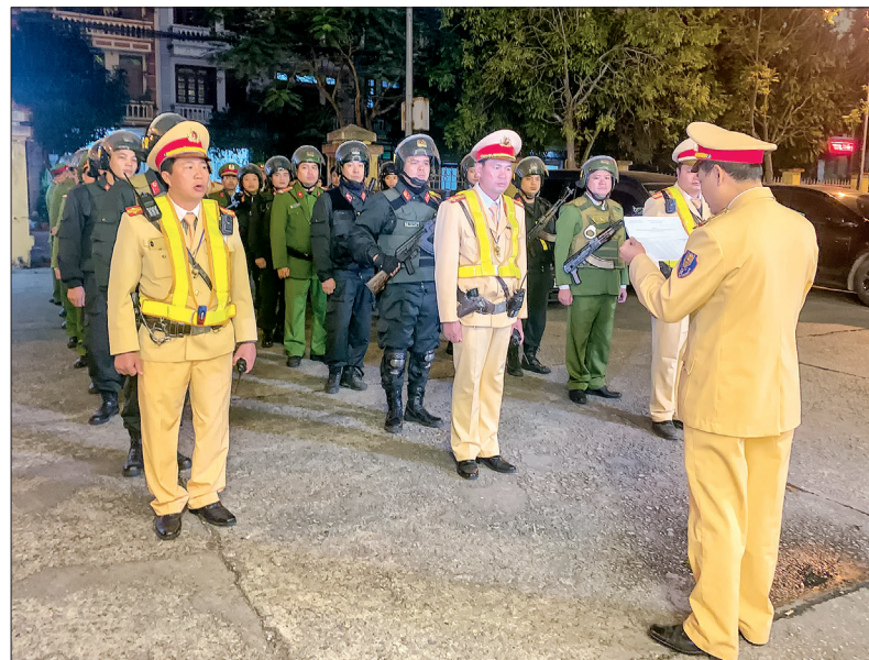
Các tổ công tác đặc biệt trước giờ lên đường làm nhiệm vụ.