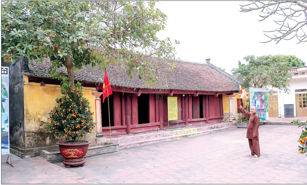
Chùa Nghiêm Phúc, xã Thái Thịnh (Thái Thụy) - khu di tích lịch sử cách mạng Thán Hưởng xưa.

Tước tình hình đó, tháng 10/1945, Ban Chấp hành Tỉnh ủy lâm thời đã họp bầu Ban Chấp hành chính thức và đề ra một số nhiệm vụ cấp bách nhằm củng cố chính quyền, chống lại nạn lụt, đẩy lùi nạn đói, ổn định đời sống nhân dân. Nhiệm vụ đầu tiên là phải nhanh chóng hàn đắp hai đoạn đê bị vỡ. Từ tháng 9/1945 đến tháng 10/1945, hàng vạn nhân công được huy động làm việc cả ngày lẫn đêm, đến cuối năm 1945 việc đắp hai đoạn đê cơ bản hoàn thành. Ngày 10/1/1946 và ngày 28/4/1946, Bác Hồ về thăm Thái Bình, thăm đoạn đê Địch và đê Mỹ Lộc. Người động viên nhân dân Thái Bình đoàn kết, ra sức diệt giặc đói, giặc dốt, giặc ngoại xâm. Những lời căn dặn của Chủ tịch Hồ Chí Minh là nguồn cổ vũ, động viên lớn lao đối với Đảng bộ và nhân dân Thái Bình trong những ngày đầy khó khăn, gian khổ ấy. Nhân dân toàn tỉnh tích cực hưởng ứng các phong trào "nuông cơm sẻ áo", "hũ gạo chống đói", "một miếng khi đói bằng một gói khi no"... quyền góp lương thực giúp đỡ những gia đình khó khăn đồng thời tập trung vào việc chăm bón lúa và hoa màu vụ chiêm năm 1946. Do vậy, vụ chiêm thu hoạch thắng lợi, lương thực và thực phẩm dồi dào, giặc đói bị nhân dân ta đẩy lùi. Đời sống vật chất của nhân dân trong tỉnh có bước cải