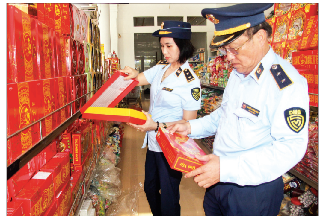
Đội Quản lý thị trường số 3 kiểm tra hoạt động kinh doanh bánh kẹo trên địa bàn huyện Hưng Hà.