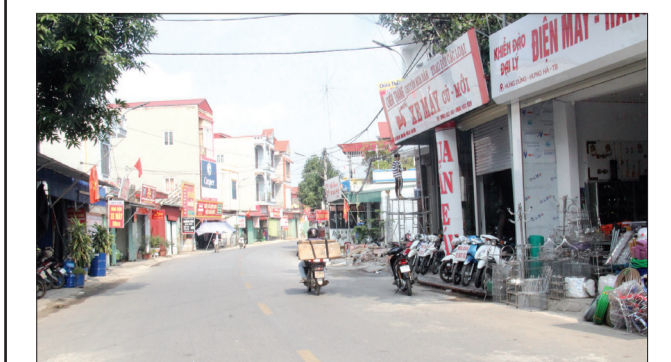
Hưng Hà tạo nguồn thu đầu giá quyền sử dụng đất xử lý nợ đọng xây dựng cơ bản và kiến thiết hạ tầng kinh tế - xã hội.