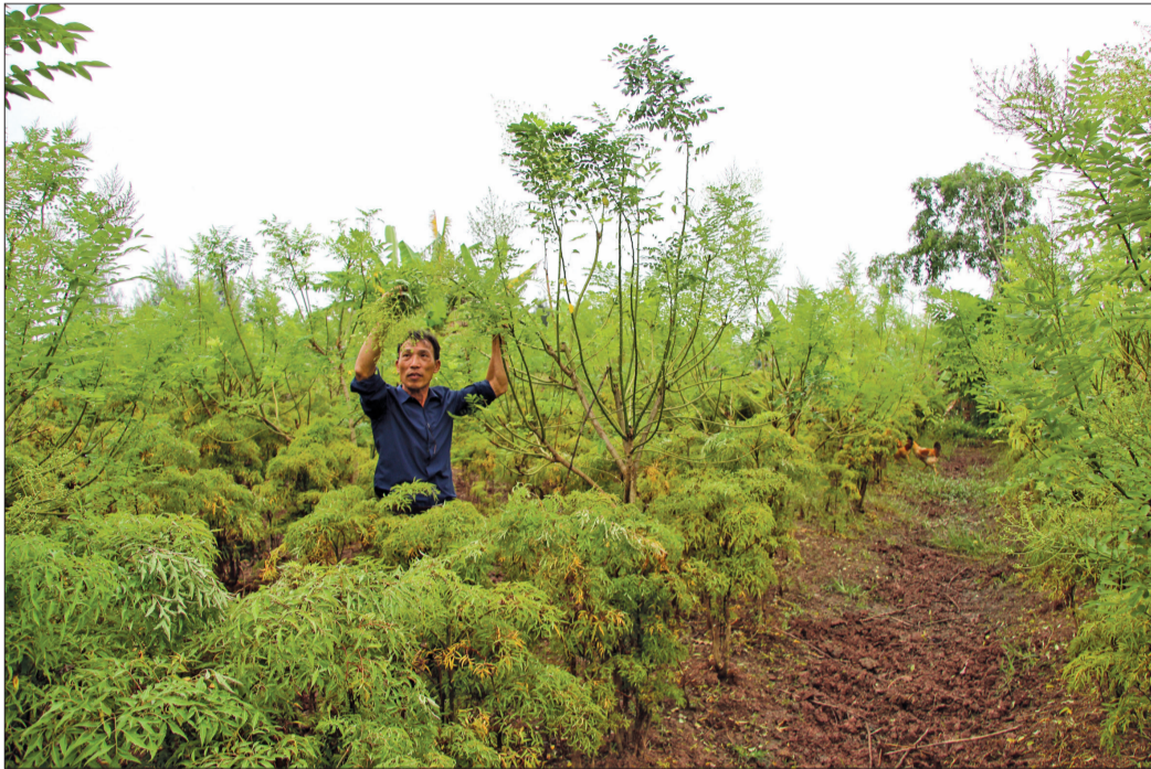
Nông dân xã Nam Hồng (Tiền Hải) trồng cây dược liệu mang lại hiệu quả kinh tế cao.

Chuyển đổi những cây trồng kém hiệu quả sang trồng cây dược liệu hàng hóa là hướng phát triển mới trong nông nghiệp ở Tiền Hải, bước đầu cho hiệu quả kinh tế ổn định, giúp nhiều hộ nông dân vươn lên thoát nghèo và làm giàu.