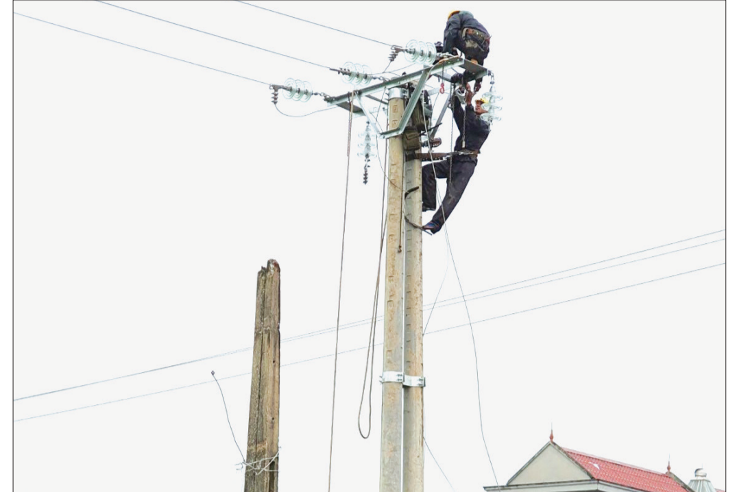
Công nhân Điện lực Thái Thụy thay thế lộ đường dây Dương Thanh từ 10kV lên 22kV.

Điện lực Thái Thụy hiện có hơn 98.000 khách hàng với tổng sản lượng điện tiêu thụ trong 4 tháng đầu năm nay đạt hơn 80 triệu kWh, trung bình đạt 20 triệu kWh/tháng. Tuy nhiên, trong những tháng mùa hè, do nhu cầu sử dụng điện của người dân, các cơ sở sản xuất tăng cao nên tổng sản lượng điện tiêu thụ trên địa bàn huyện trung bình đạt khoảng 25 triệu kWh/tháng, tăng hơn 20%. Nhằm bảo đảm cấp điện an toàn, liên tục, ổn định cho các phụ tải trên địa bàn, Điện lực Thái Thụy đang triển khai đồng bộ các giải pháp, trong đó tập trung đẩy nhanh tiến độ các dự án đầu tư xây dựng và sửa chữa lưới điện. Ông Nguyễn Thành Chung, Giám đốc Điện lực Thái Thụy cho biết: Từ đầu năm đến nay đơn vị đã được Công ty Điện lực Thái Bình đầu tư 12 dự án xây dựng lưới điện trung thế, trong đó có 11 dự án cải tạo, nâng cấp đường dây từ 10kV lên 22kV và 1 dự án xây trạm biến áp chống quá tải khu vực các xã: Thụy Việt, Thụy Trinh, Thụy Hải. Điện lực Thái Thụy đã chủ động xây dựng kế hoạch tổng thể cho từng công trình, từ đó rà soát, đôn đốc tiến độ thực hiện, tập trung chỉ đạo tháo gỡ khó khăn vướng mắc trong quá trình