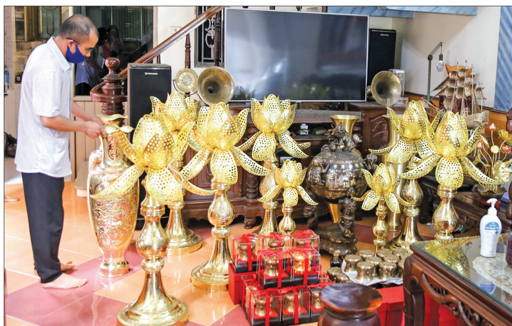
Sử dụng hiệu quả vốn vay từ Quỹ TDND Trà Giang, cơ sở sản xuất đồ đồng mỹ nghệ của anh Trịnh Quốc Lực (thôn Diệm Dương Đông) tạo việc làm cho 10 lao động với thu nhập từ 6 - 7 triệu đồng/người/tháng.