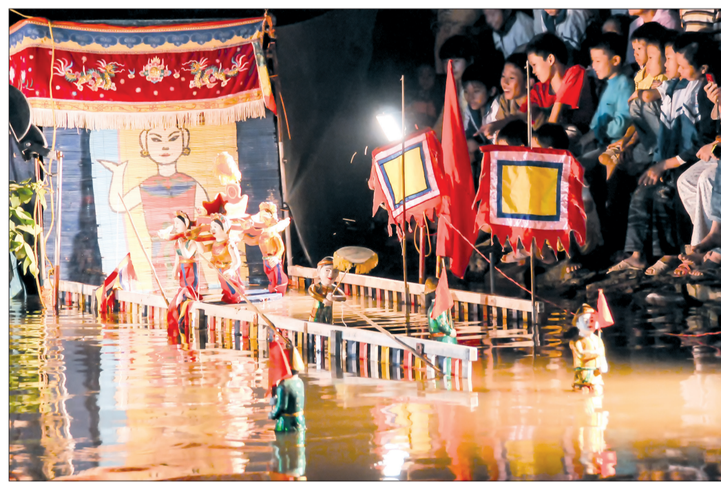
Múa rối nước Nguyễn Xá (Đông Hưng).

thể, tinh hoa của nghệ thuật múa rối nước còn vượt ra ngoài biên giới quốc gia, đến với nhiều nước trong khu vực và trên thế giới. Vào thập kỷ 70 - 80 của thế kỷ XX, múa rối nước Nguyễn Xá thường được đi biểu diễn tại nhiều nước Đông Âu, Tây Âu, từng được báo chí các nước ca ngợi là nghệ thuật có một không hai trên thế giới. Từ năm 1975 trở lại đây, hầu hết các cuộc liên hoan múa rối nước toàn quốc, hai phường rối của Thái Bình đều tham dự và thường giành được giải cao. Sau một thời gian ngắn khôi phục, phường múa rối nước làng Đông đã phục dựng được 12 trò diễn và xây dựng vở tuồng dài "Hội thể Đông Quan". Tháng 8/1994, phường tham gia liên hoan múa rối nước toàn quốc tổ chức tại Hà Nội, đạt 3 huy chương vàng, 3 huy chương bạc, được ban tổ chức đánh giá cao. Năm 2007, phường múa rối nước làng Nguyễn đã được Đài Loan mời sang biểu diễn phục vụ trong một tháng rưỡi. Thời gian này, múa rối nước Thái Bình đang trong