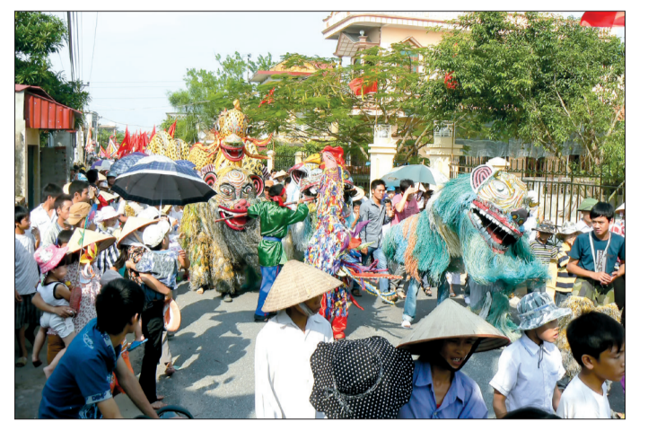
Lễ hội đình làng Bái.