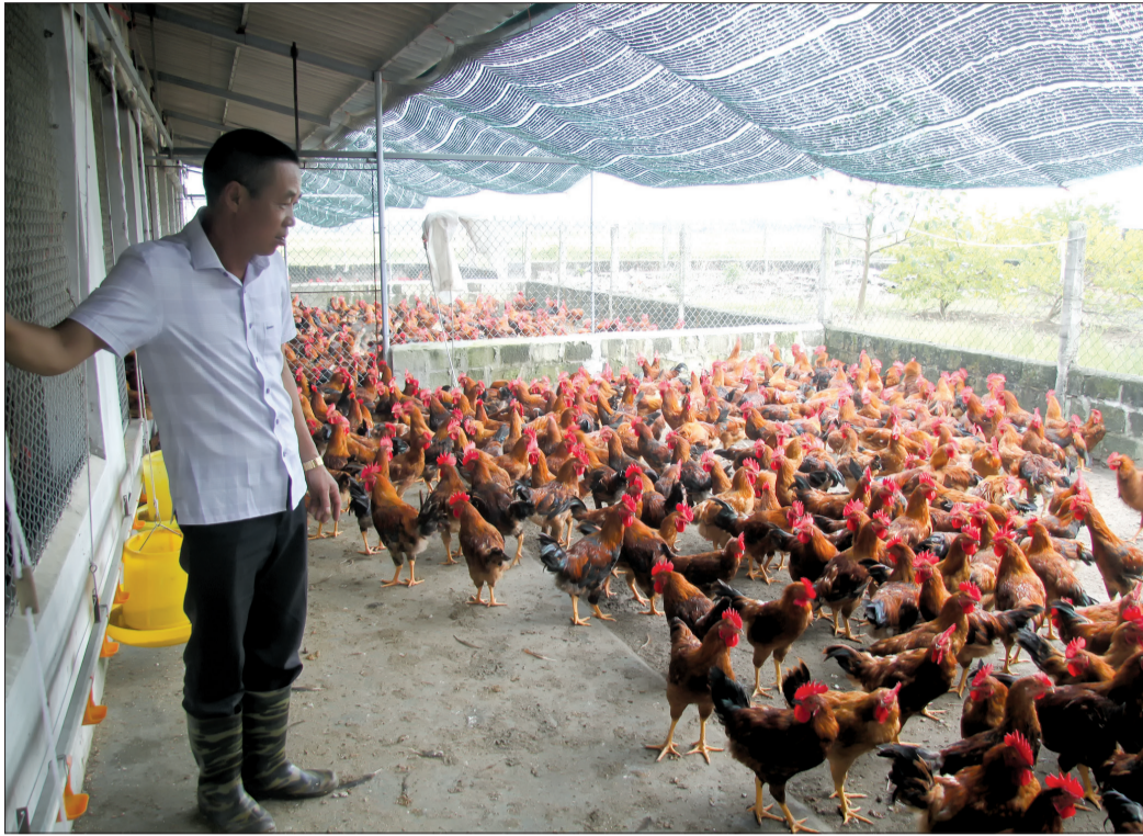
Việc áp dụng khoa học kỹ thuật vào chăn nuôi giúp nhiều nông dân làm giàu.

Thời gian qua, các cấp hội nông dân trong tỉnh ghi dấu ấn qua những phong trào, công trình, phần việc cụ thể, thiết thực, góp phần tích cực vào việc xây dựng nông thôn mới (NTM) cũng như phát triển kinh tế - xã hội địa phương.