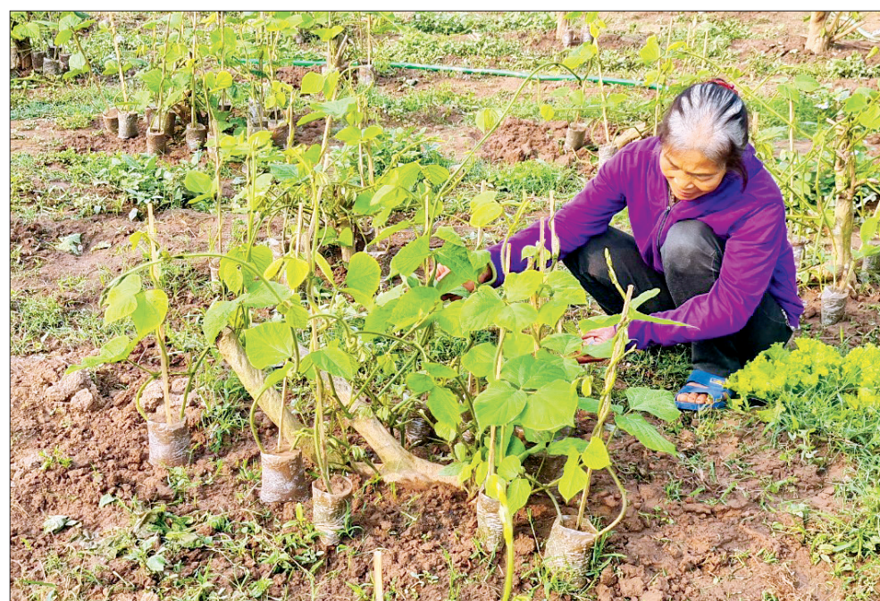
Mỗi vụ HTX nhân giống khoảng 1.000 gốc sắn dây cung cấp cho người dân trong và ngoài xã trồng.