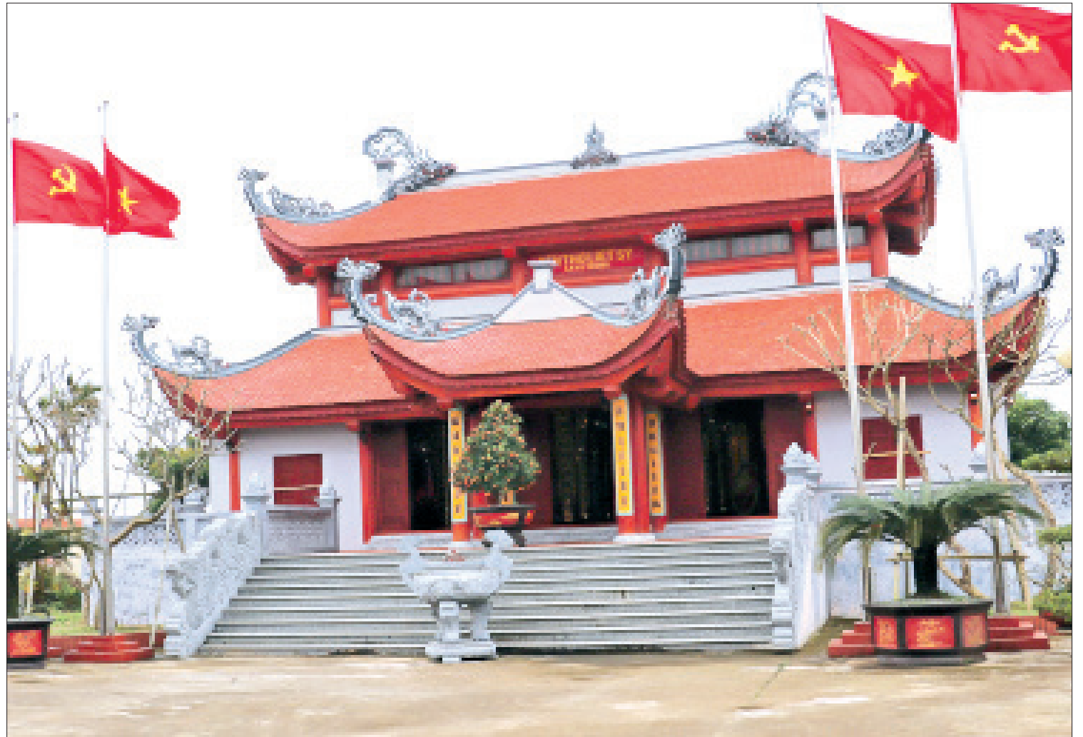
Đền thờ liệt sĩ xã Vũ Trung (Kiến Xương) - địa chỉ đỏ giáo dục truyền thống quê hương.