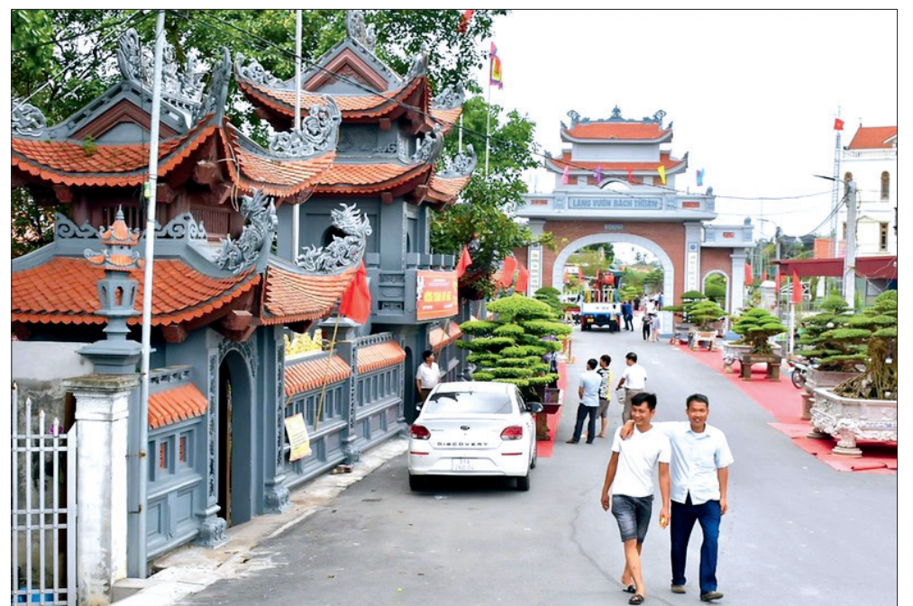
Bách Thuận đang trong lộ trình xây dựng thành làng vườn du lịch sinh thái cộng đồng đầu tiên của tỉnh Thái Bình.