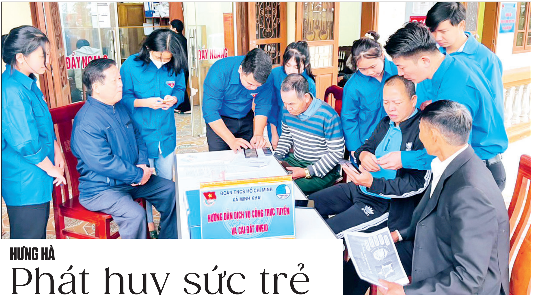
Đoàn viên, thanh niên xã Minh Khai hướng dẫn đăng ký, kích hoạt tài khoản định danh điện tử VneID; quy trình sử dụng dịch vụ công trực tuyến.