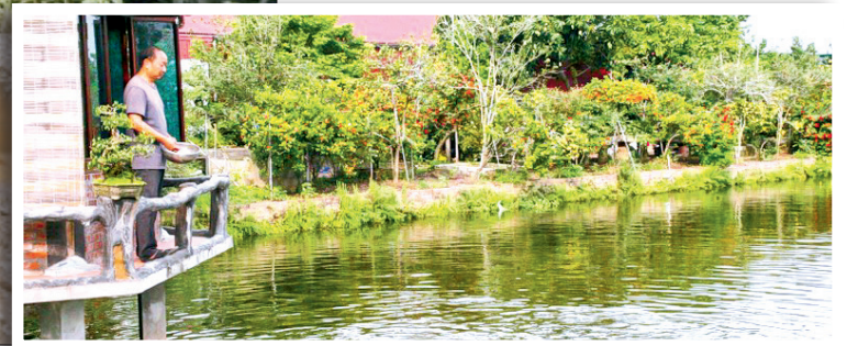
Phát triển du lịch xanh, gắn bó với thiên nhiên là lợi thế sẵn có của xã Bách Thuận.