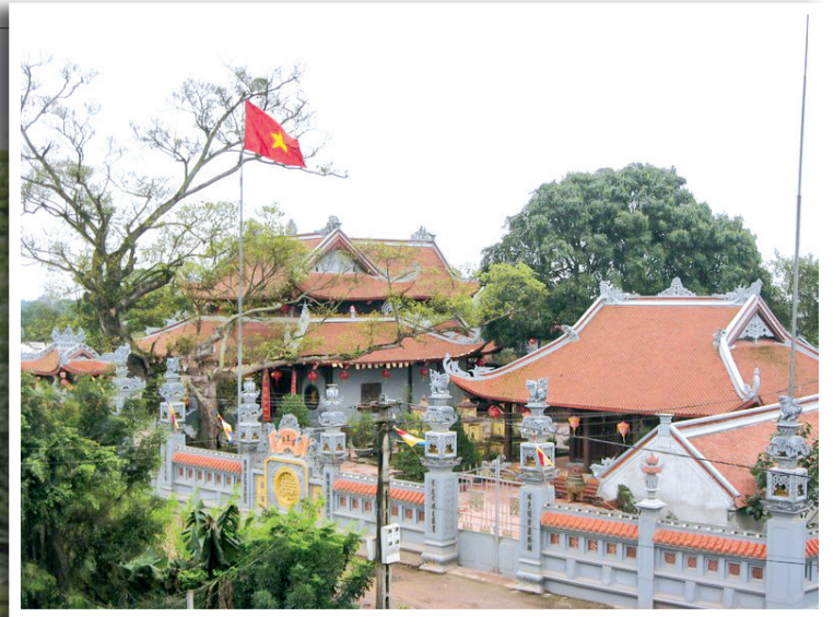
Di tích quốc gia chùa Từ Vân, một địa điểm lịch sử, văn hóa hấp dẫn tại xã Bách Thuận.