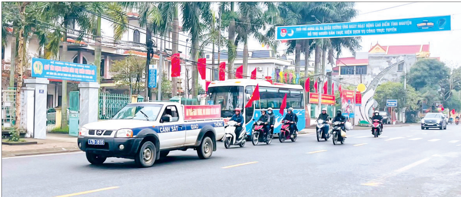
Thanh niên thị trấn Hưng Hà tuyên truyền lưu động về lợi ích công nghệ số.

Bằng sự năng động, nhạy bén với khoa học công nghệ, thời gian qua, tuổi trẻ huyện Hưng Hà đã có nhiều giải pháp sáng tạo, tích cực tiên phong trong việc đẩy mạnh chuyển đổi số trên các lĩnh vực, góp phần thực hiện mục tiêu phát triển kinh tế - xã hội của địa phương.