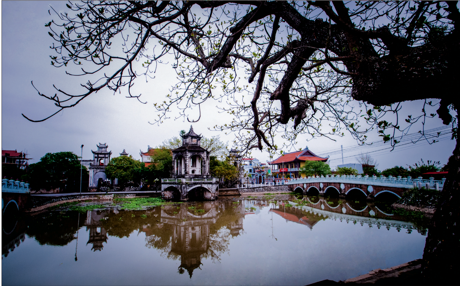
Đền Đồng Xâm, xã Hồng Thái, huyện Kiến Xương - di tích lịch sử văn hóa quốc gia, minh chứng vùng đất gần 2500 năm, nơi phối thờ ông tổ nghề chạm bạc.

Chuyện về chiếc búa sắt của Triệu Đà thờ ở đền Đồng Xâm, xã Hồng Thái, huyện Kiến Xương được thuật lại: “Triệu Vũ Đế được vua nhà Hán giao cho một chiếc búa sắt “Thiệt Việt”, rồi lại giao cho cai quản địa phận Giao Châu, lỵ sở đóng ở Quảng Đông, sau đó đi tuần hành, xem xét công việc của bộ thuộc các nơi, đến xã Đường Thâm, Đế lấy con gái nhà họ Trình làm vợ. Khi Đế chết, dân lập đền thờ, chiếc búa sắt cũng được thờ ở đấy”. Bước chân đến cổng đền, ngẩng mặt nhìn về hướng mặt trời mọc, mặt tiền đền Đồng Xâm đắp nổi ba chữ “Nhất thống thủy” bằng gốm sứ cổ xưa, dụng ý của tiền nhân nhắn nhủ hậu thế rằng lịch sử nước Việt ta khởi thủy từ nhà Triệu nhất thống sơn hà.