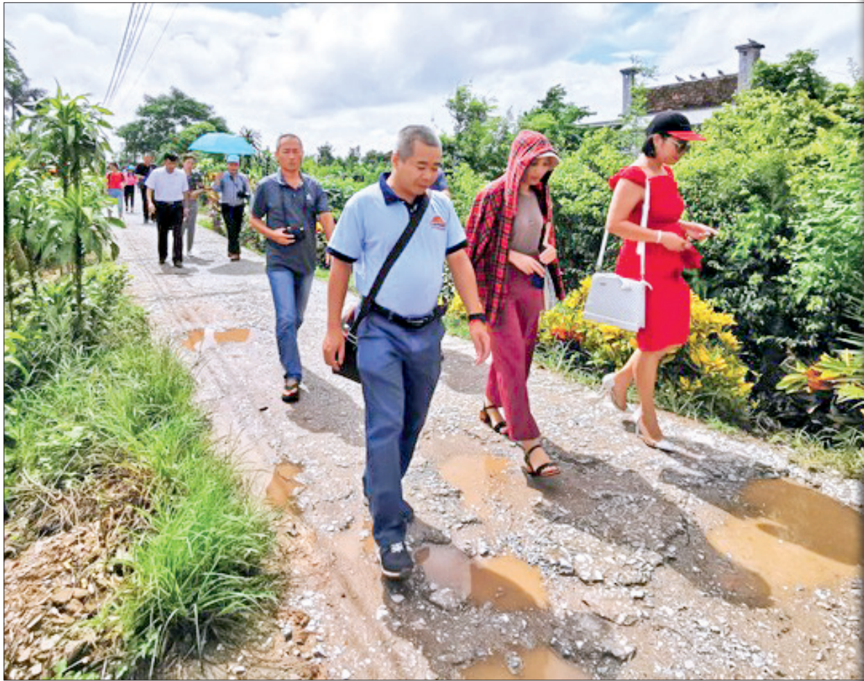
Với tiềm năng lớn trong phát triển du lịch sinh thái cộng đồng, thời gian qua xã Bách Thuận (Vũ Thư) đón một số đoàn khách trong và ngoài nước đến khảo sát, tìm kiếm cơ hội phát triển du lịch.