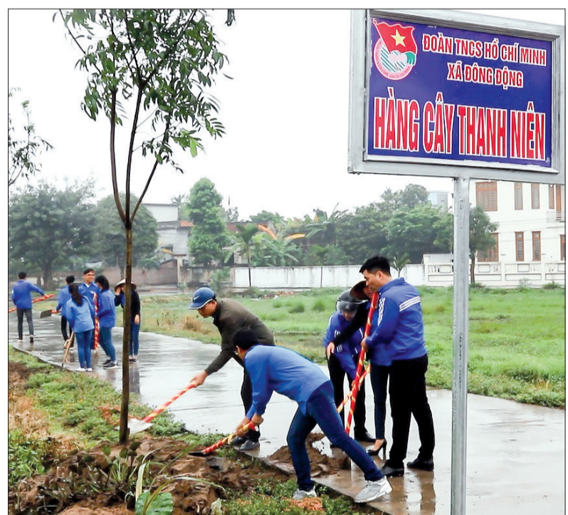
Huyện đoàn Đông Hưng ra quân trồng cây tại xã Đông Động.

Đây là các hoạt động thiết thực hưởng ứng đợt ra quân chủ nhật xanh lần thứ nhất năm 2019 và thi đua tuổi trẻ Thái Bình làm theo Di chúc của Chủ tịch Hồ Chí Minh, góp phần nâng cao nhận thức, vai trò, trách nhiệm của mỗi cán bộ, đoàn viên, hội viên, thanh thiếu nhi và nhân dân trong việc bảo vệ môi trường sống xanh, sạch, đẹp.