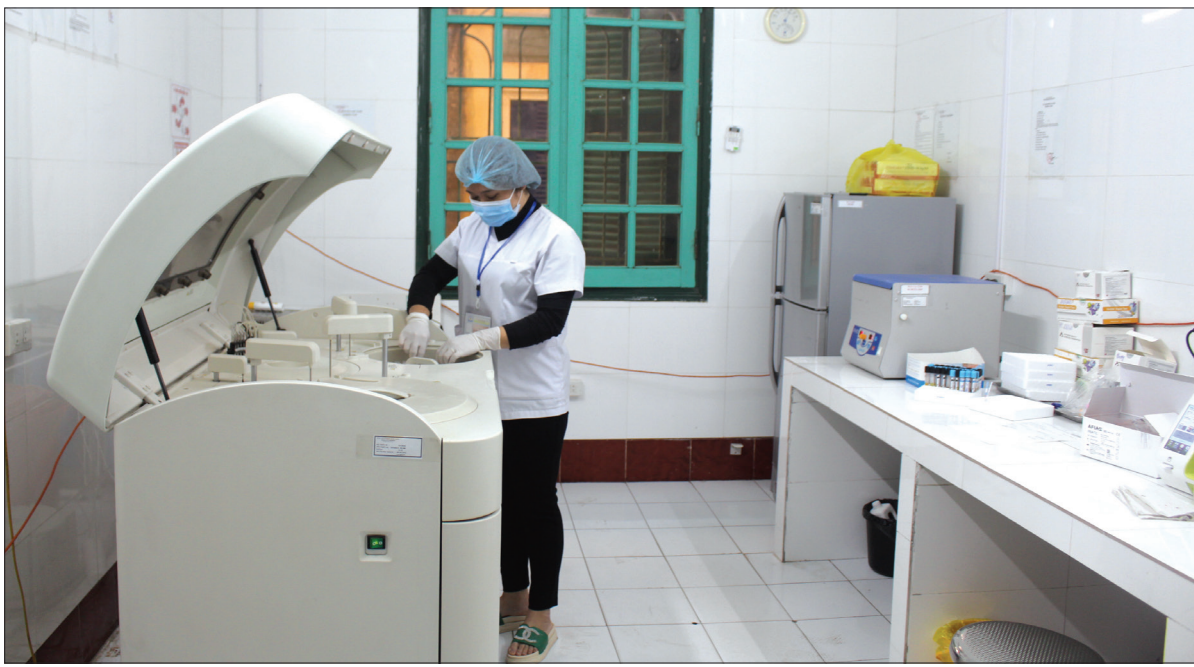
Cán bộ Bệnh viện Đa khoa Hùng Nhân làm xét nghiệm cho người bệnh.

Cùng với cơ sở vật chất, trang thiết bị, nhân lực được xem như "kiềng ba chân" tạo thế phát triển vững chắc cho các bệnh viện, góp phần thực hiện tốt công tác khám chữa bệnh. Tuy nhiên, khi số lượng bác sĩ vẫn còn thiếu thì việc phát triển nhân lực y tế chất lượng cao vẫn là bài toán khó, nhất là với các bệnh viện tuyến huyện.