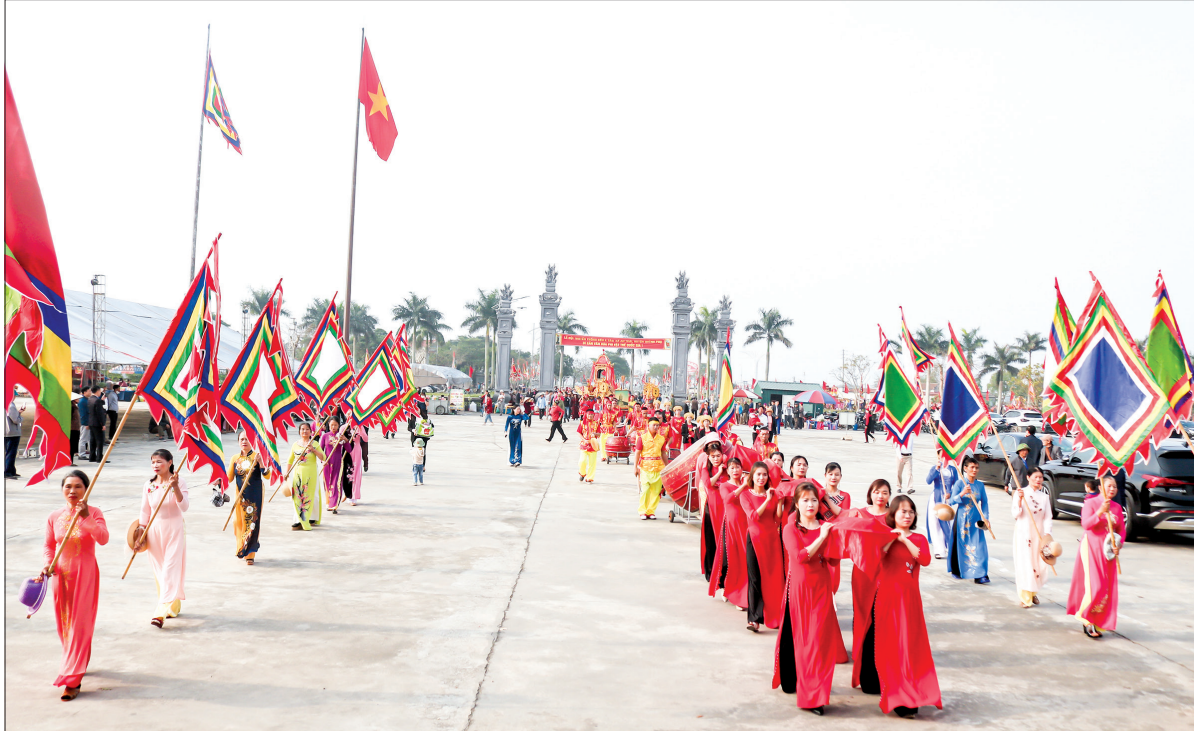
Lễ rước bộ tại lễ hội truyền thống đến A Sào, xã An Thái (Quỳnh Phụ).

Thực hiện Nghị quyết số 04-NQ/TU, ngày 30/1/2019 của Ban Chấp hành Đảng bộ tỉnh về "Tăng cường giáo dục, phát huy truyền thống văn hóa, văn hiến, yêu nước, cách mạng của quê hương Thái Bình cho cán bộ, đảng viên và các tầng lớp nhân dân", thời gian qua, cùng với tập trung phát triển kinh tế, huyện Quỳnh Phụ luôn chú trọng gìn giữ nét đẹp văn hóa, coi văn hóa là một trong những nội dung then chốt, bảo đảm tính bền vững và là nền tảng, động lực quan trọng để thực hiện hiệu quả mục tiêu xây dựng nông thôn mới (NTM) nâng cao, NTM kiểu mẫu.