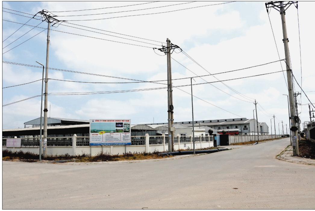
Cụm công nghiệp Minh Lăng (Vũ Thu) là địa chỉ hấp dẫn với nhiều nhà đầu tư trong và ngoài nước vì có hạ tầng tốt, giao thông thuận lợi.

Từ kết quả hoạt động của các cụm công nghiệp (CCN) trên địa bàn tỉnh thời gian qua và đòi hỏi của thực tiễn, nhất là chủ trương phát triển công nghiệp mà Đại hội Đảng bộ tỉnh lần thứ XX, nhiệm kỳ 2020 - 2025 đã xác định, các chuyên gia cho rằng việc phát triển các CCN trong thời gian tới cần có sự liên kết là một trong những yếu tố để phát huy tối đa hiệu quả kinh tế.