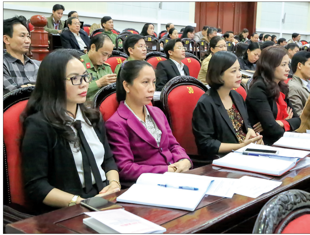
Các đại biểu dự hội nghị.

Phát biểu bế mạc hội nghị, đồng chí Võ Văn Thưởng, Ủy viên Bộ Chính trị, Bí thư Trung ương Đảng, Trưởng ban Tuyên giáo Trung ương đề nghị các tỉnh ủy, thành ủy, đảng ủy trực thuộc Trung ương và các tổ chức đảng ngay sau hội nghị này cần tiếp tục tổ chức các hội nghị học tập, quán triệt các nghị quyết ở địa phương, đơn vị mình bảo đảm chất lượng, đúng thời gian quy định; bố trí thời gian hợp lý để thảo luận chương trình kế hoạch hành động, xây dựng lộ trình thực hiện sát thực tế, đưa nghị quyết vào cuộc sống.