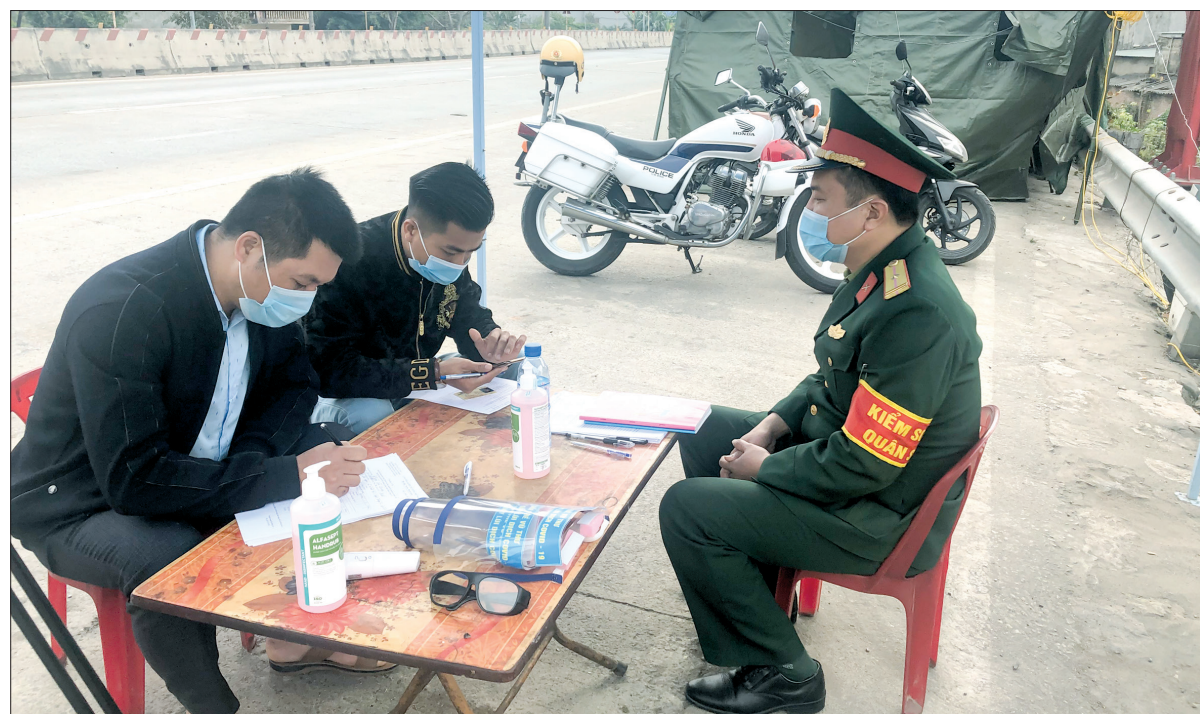
Người dân khai báo y tế tại chốt kiểm soát dịch cầu Tân Đệ.

Ngày 28/1, khi từ tỉnh có dịch về, anh Đ.V.H, xã Vũ Lăng (Tiền Hải) đã đến ngay Trạm Y tế xã để khai báo y tế. Tại đây, anh được cán bộ Trạm Y tế xã hướng dẫn khai báo y tế, khai báo thân nhiệt và yêu cầu cách ly tại nhà. Anh Đ.V.H chia sẻ: Từ thông tin trên báo, đài tôi thấy dịch bệnh lần này rất nguy hiểm, chủng virus mới lây lan nhanh, số người nhiễm nhiều nên rất lo. Vì thế, ngay khi về địa phương tôi đã thông báo với chính quyền địa phương, sau đó đi khai báo y tế. Sau khi khai báo y tế, tôi tự cách ly ở nhà, thường xuyên đeo khẩu trang, hạn chế tiếp xúc, giữ khoảng cách với mọi người.