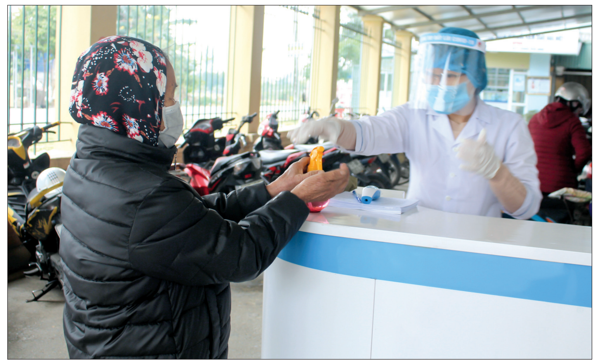
Người dân khi đến khám chữa bệnh tại Bệnh viện Phổi Thái Bình được hướng dẫn rửa tay sát khuẩn.

Cùng với việc bảo đảm an toàn tại các cơ sở khám chữa bệnh, ngành Y tế đã huy động lực lượng phối hợp với các ngành, địa phương kích hoạt lại các tổ giám sát cộng đồng, khẩn trương truy vết những trường hợp tiếp xúc với người