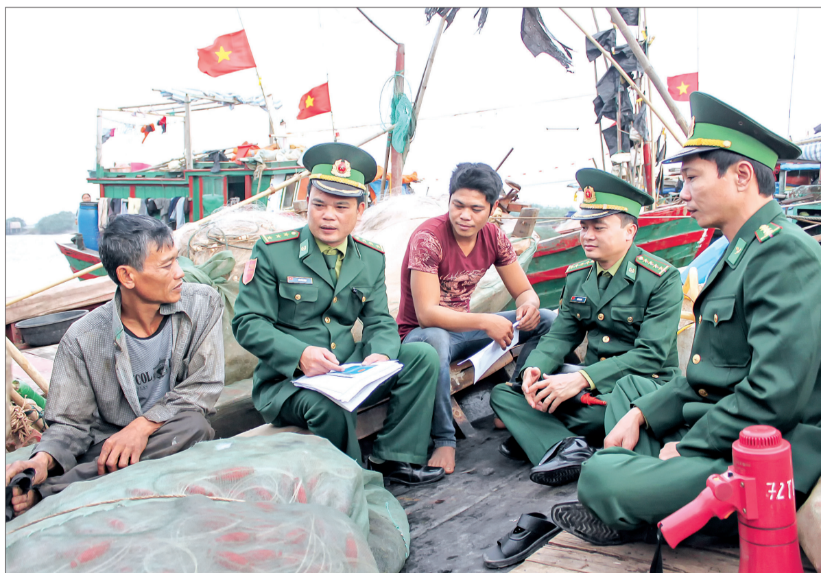
Cán bộ Trạm Kiểm soát biên phòng Cửa Lân (Bộ đội Biên phòng tỉnh) tuyên truyền, phổ biến pháp luật đến bà con ngư dân.