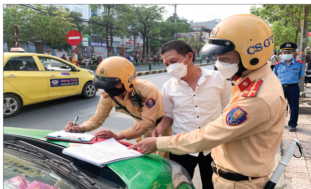
Lực lượng cảnh sát giao thông (Công an thành phố Thái Bình) lập biên bản xử lý các trường hợp dùng, đỗ xe trái quy định.