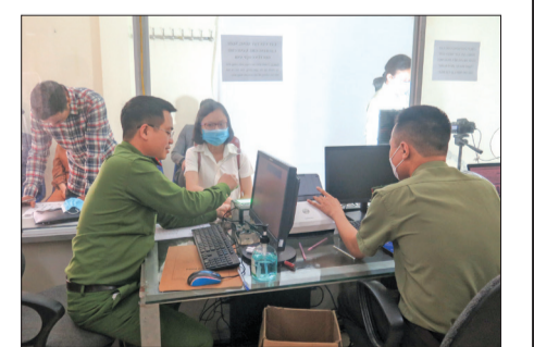
Người dân làm thủ tục cấp căn cước công dân tại trụ sở Công an huyện Kiến Xương.