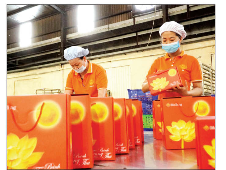
Phục vụ thị trường trung thu năm nay, Bảo Hưng cung cấp khoảng 800.000 sản phẩm các loại.