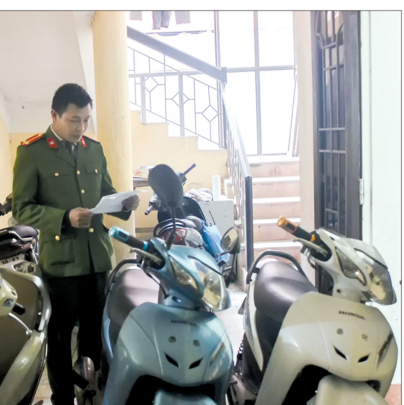
Công an thành phố Thái Bình kiểm tra tang vật các vụ trộm cắp.

kiểm soát tình hình, ngăn chặn kịp thời các phần tử có dấu hiệu hoạt động phạm tội; đồng thời, đấu tranh hiệu quả với các loại tội phạm, nhất là tội phạm hoạt động có tổ chức, "xã hội đen", tội phạm cướp, cướp giật, trộm cắp tài sản, cố ý gây thương tích, chống người thi hành công vụ, gây rối trật tự công cộng... Bên cạnh đó, lực lượng cảnh sát quản lý hành chính về trật tự xã hội, cảnh sát khu vực, công an phụ trách xã, công an viên kiểm tra chặt chẽ việc đăng ký tạm trú, tạm vắng ở các khách sạn, nhà nghỉ, nhà trọ, các cơ sở, ngành nghề kinh doanh có điều kiện; rà soát những đối tượng có dấu hiệu phạm tội; tuyên truyền, vận động quần chúng nhân dân tích cực tham gia đấu tranh, tố giác tội phạm. Các đơn vị đã tổ chức kiểm tra 132 cơ sở kinh