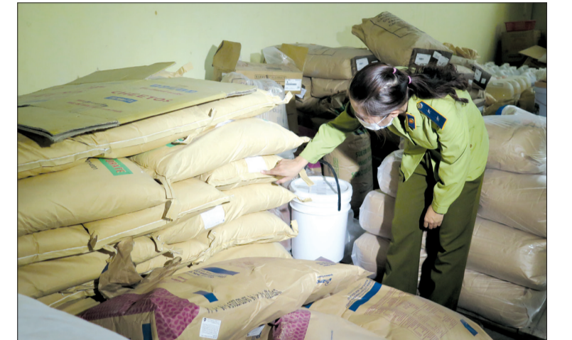
Chi cục Quản lý thị trường kiểm tra nguồn gốc xuất xứ hàng hóa tại các cơ sở sản xuất, kinh doanh thực phẩm.