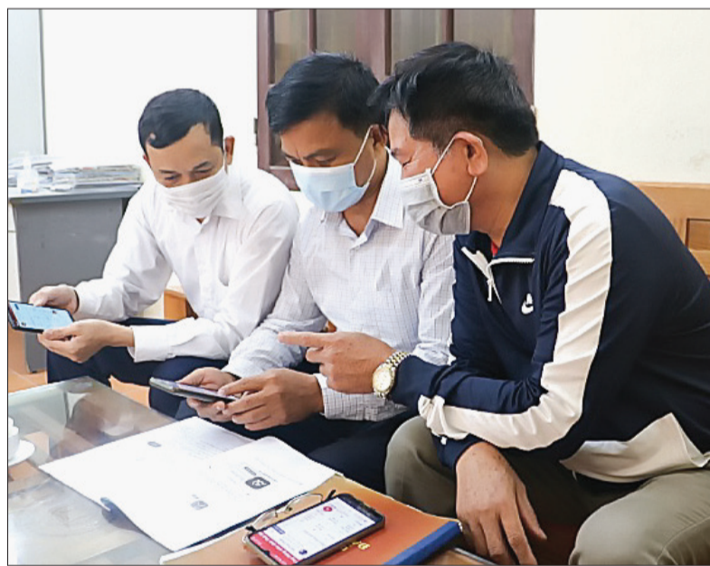
Cán bộ, đảng viên xã Đông Thọ (thành phố Thái Bình) sử dụng phần mềm sổ tay đảng viên điện tử.