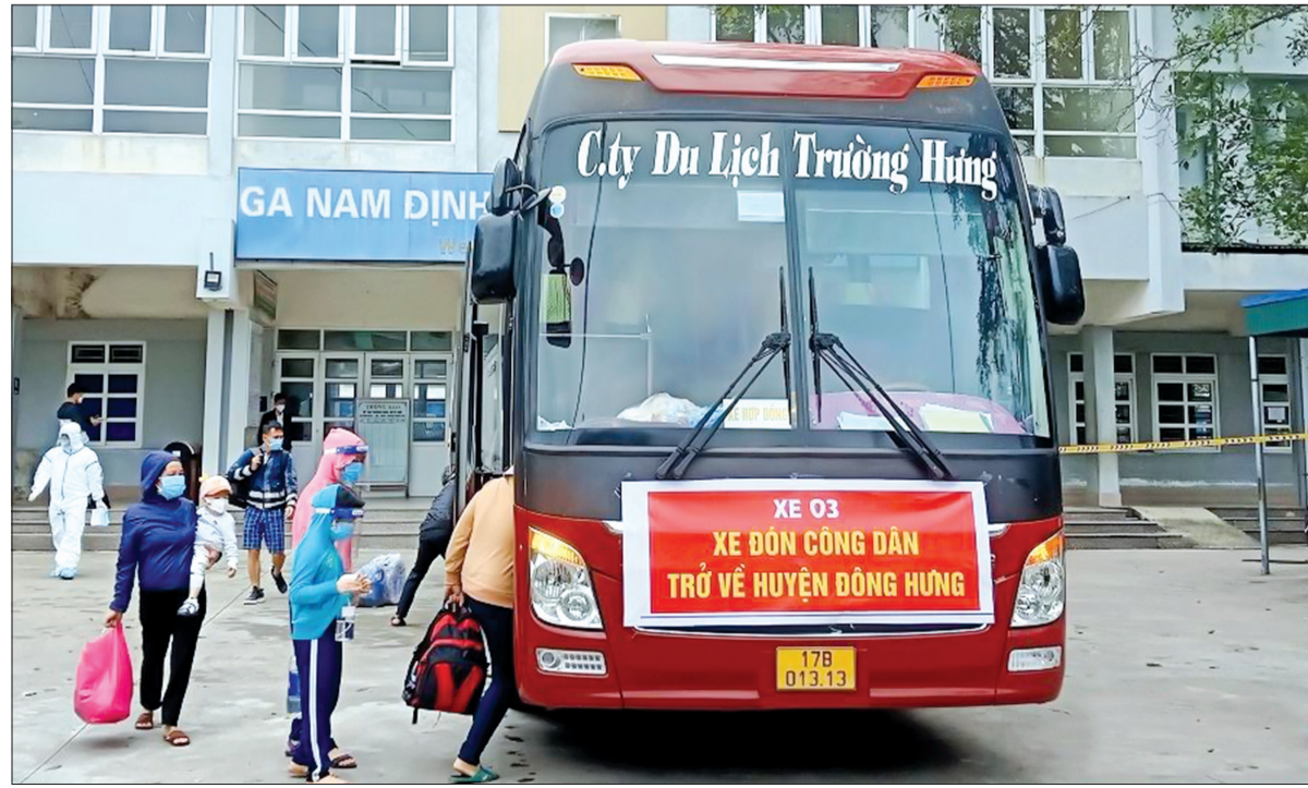
Công dân được bố trí ở đón từ ga Nam Định về khu cách ly tập trung.

về quê hương là mong muốn lớn nhất của mỗi người. Ông Nguyễn Chiến Thắng, Phó Giám đốc Sở Lao động - Thương binh và Xã hội, cơ quan thường trực của tỉnh trong việc tổ chức đưa đón công dân bị ảnh hưởng của dịch Covid-19 trở về địa phương cho biết: Công dân các tỉnh, thành phố phía Nam lúc đầu đăng ký lên đến 1.400 người. Tuy nhiên, vì nhiều lý do như ốm, có công việc chưa bố trí về được hay như một số công ty giữ ở lại làm việc nên nhiều công dân không thể về theo nguyện vọng. Cuối cùng, tổng số người hồi hương dịp này là 1.100 người, được chia làm hai đợt (trong đó có hơn 180 trẻ em và phụ nữ có thai). Sáng ngày 17/10, chúng tôi đón 498 công dân, số còn lại sẽ về tới ga Nam Định trong ngày 18/10. Các công dân về đợt đầu tập trung chủ yếu tại thành phố Thái Bình, huyện Đông Hưng, Quỳnh Phụ, Tiền Hải và Vũ Thư. Sau khi xuống ga Nam Định, lực lượng công an, quân đội, y tế, lao động - thương binh và xã hội đưa công dân tiếp tục