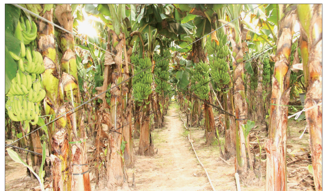
Các dãy chuối tiêu hồng được chằng chống tránh gãy đổ để chuẩn bị xuất bán.