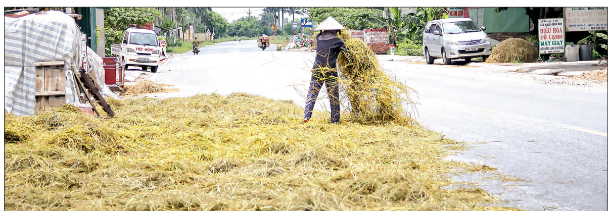
Người dân xã Phúc Khánh (Hưng Hà) biến quốc lộ 39 thành nơi phơi rơm.