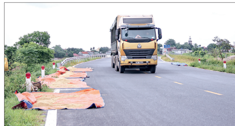
Quốc lộ 39 đoạn qua thị trấn Hưng Nhân (Hưng Hà) trở thành nơi phơi thóc của một số người dân.