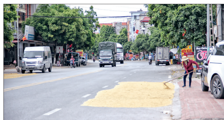
Người dân phố Tăng, xã Phú Châu (Đông Hưng) bắt chắp nguy hiểm phơi thóc trên quốc lộ 39.